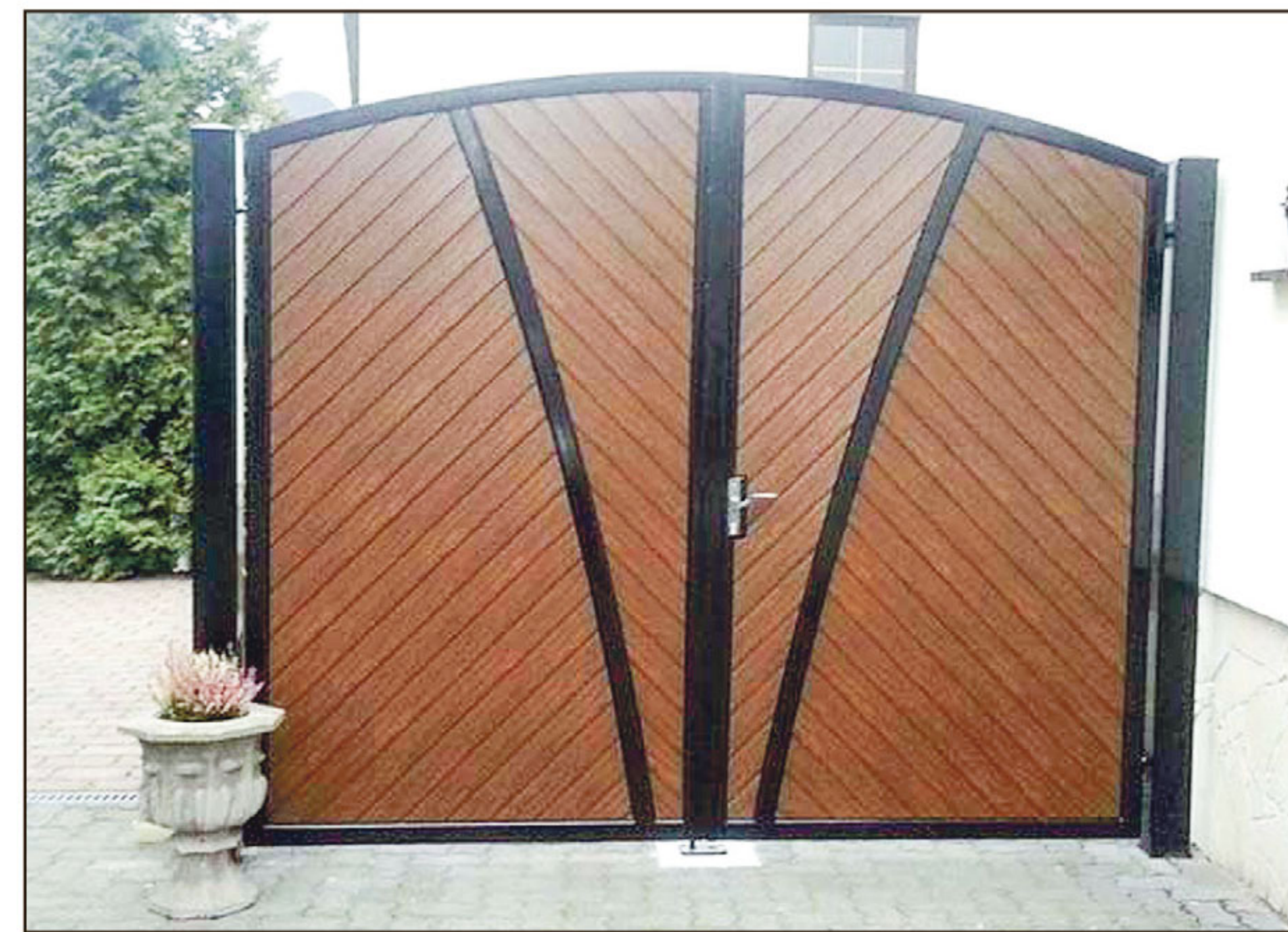
Verschiedene Tore der Firma Schlosserei & Metallbau Wagner.