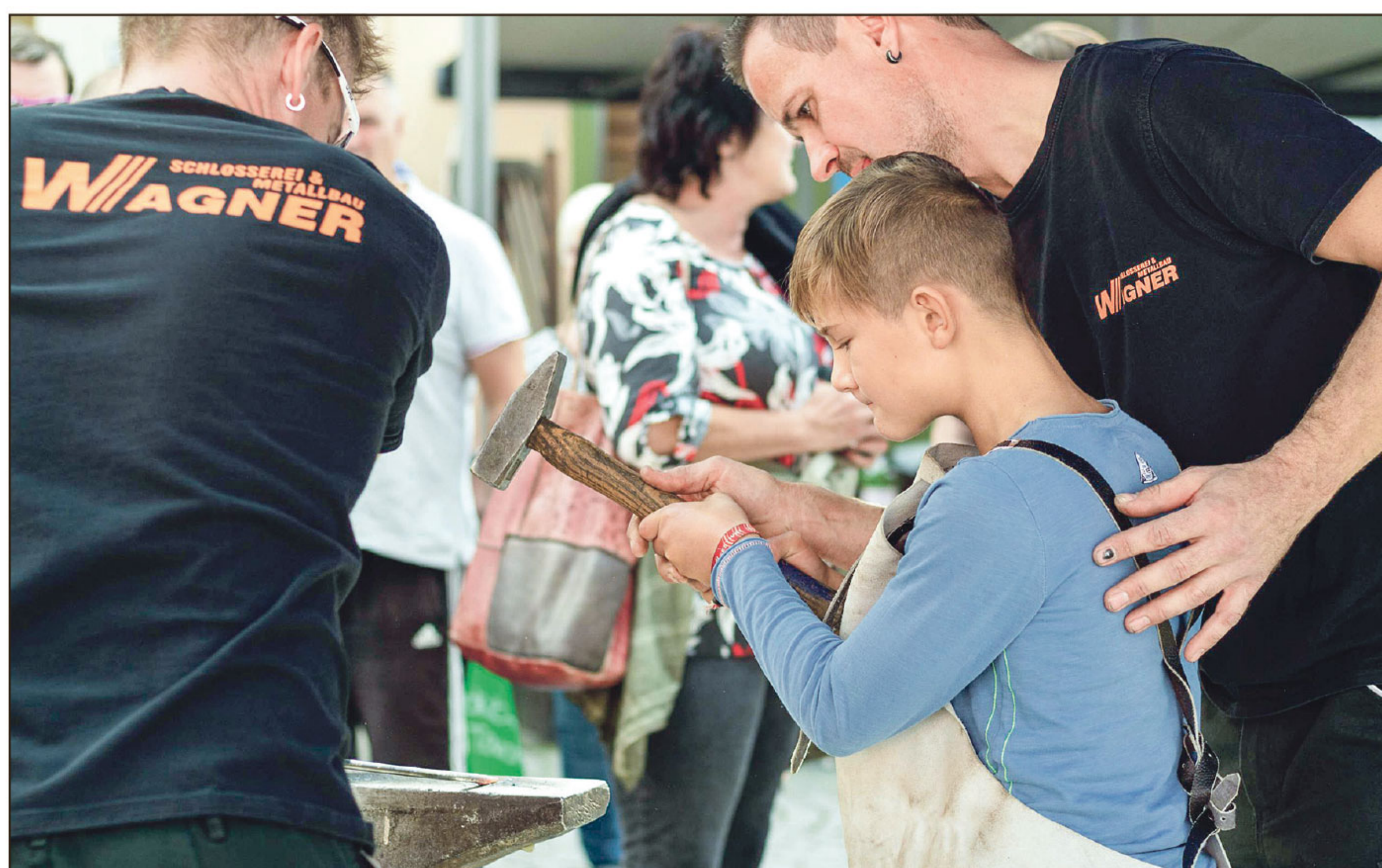
Zum Handwerkertag darf auch der Nachwuchs sein Können zeigen.