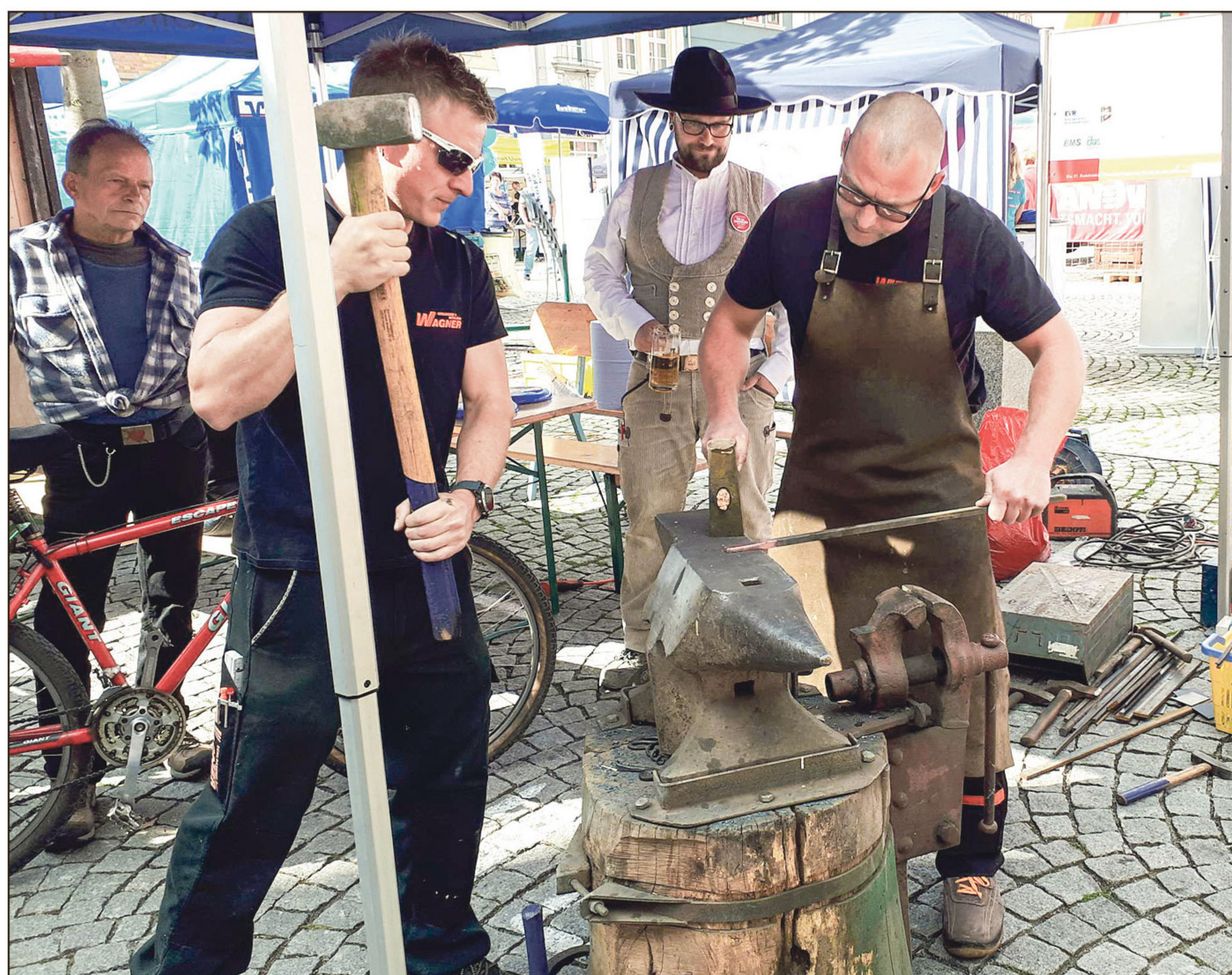
Das Handwerk will gelernt sein.