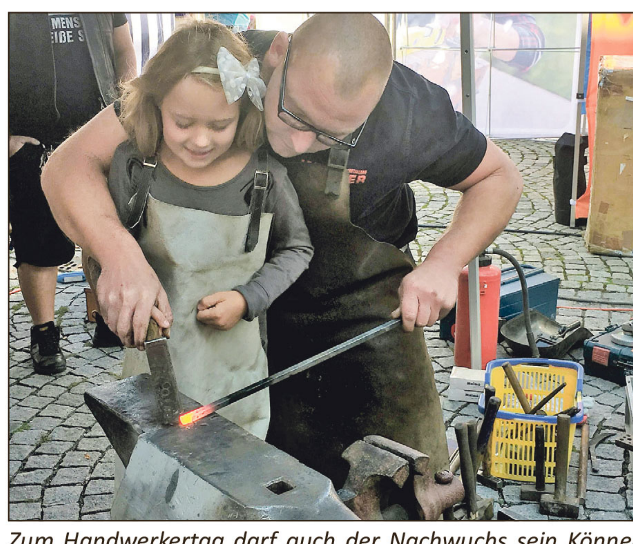
Zum Handwerkertag darf auch der Nachwuchs sein Können zeigen.