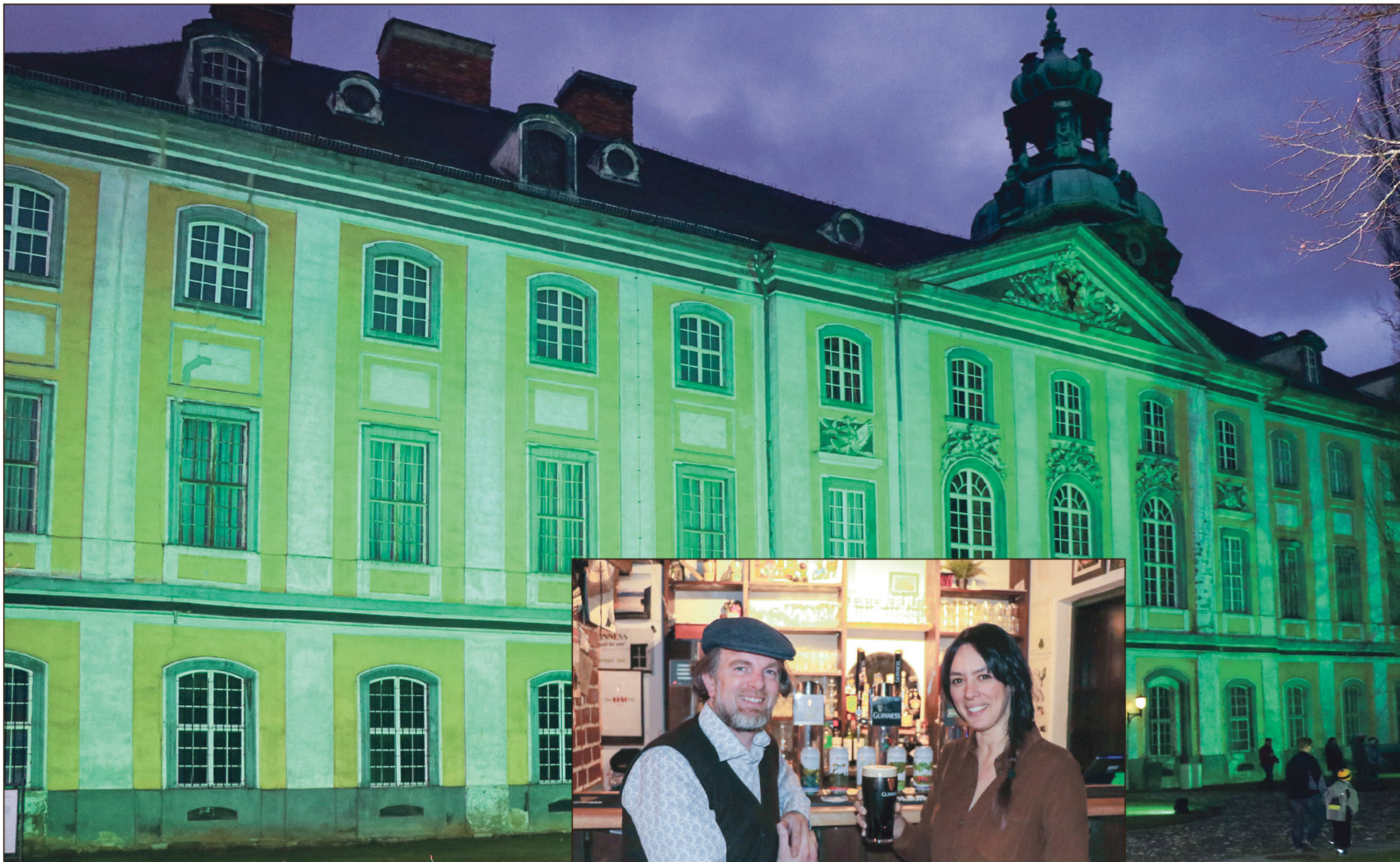
Auch Rudolstadts Wahrzeichen erstrahlt wieder ganz in grün.

Ein Hauch von Irland – und noch viel mehr zum St. Patrick's Wochenende