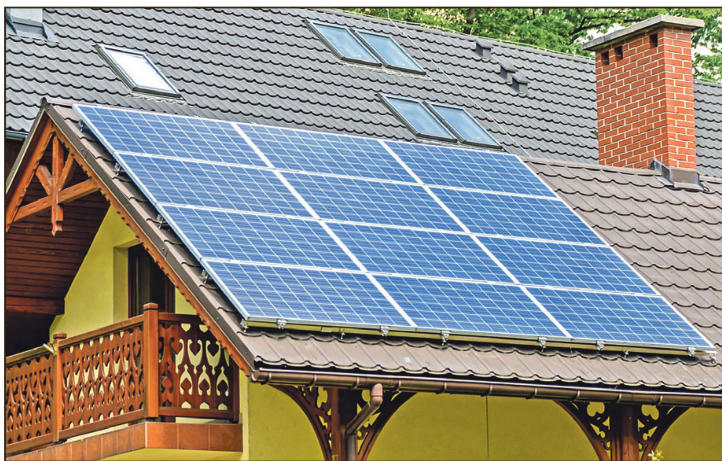
Die Auswahl an Wärmesystemen ist groß.