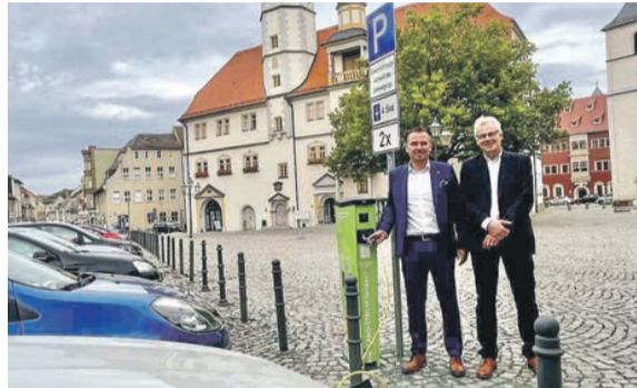
Auf dem Eisenberger Markt steht nun eine neue E-Ladesäule zur Verfügung.

Eisenberg. Die Stadtwerke Eisenberg Energie haben eine neue Ladesäule am Eisenberger Markt in Betrieb genommen. Seit einigen Tagen haben auch PKW-Fahrer die Möglichkeit ihre Elektro- oder Hybridfahrzeuge an der Ladesäule am Markt mit Strom zu versorgen. Die bisherige Lademöglichkeit für E-Bike-Akkus besteht auch weiterhin. Bis zu zwei E-Fahr-