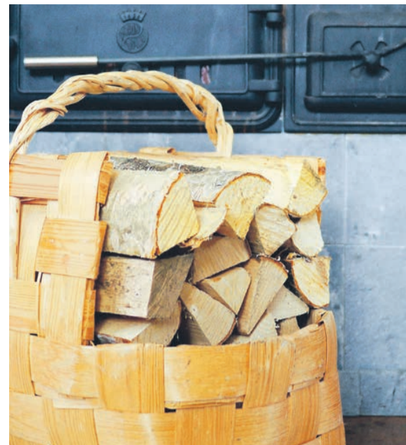
Beim Heizen mit Holz gibt es einiges zu beachten.

Nach den Immissionsschutzvorgaben gehört nur gut getrocknetes Stückholz in den Ofen. Zeitungen gehören dagegen ins Altpapier, Joghurtbecher in den Verpackungsmüll. Alte Fensterrahmen und Spanplatten müssen auf der Deponie entsorgt werden. Frisch produziertes Scheitholz muss mindestens ein, besser zwei Jahre an einem gut belüfteten Ort trocknen, bevor es für den Ofen bereit ist. Vorher brennt es schlechter, erzeugt weniger nutzbare Wärme und setzt bei der Verbrennung Schadstoffe frei. Wer einen Ofen nutzen möchte, sollte sich vorher informieren, wie dieser richtig befeuert wird. Dazu gehören sorgfältig geschichtetes Holz, kleine Scheiterschnitte für schnelles Abbrennen, Anzünden von oben mit wachsgetränkter Holzwohle, möglichst ungestörtes Abbrennen und kein Nachlegen von Scheiten. Weitere Informationen – auch zum richtigen Anheizen – gibt es beim Umweltbundesamt und beim Schornsteinfeger-