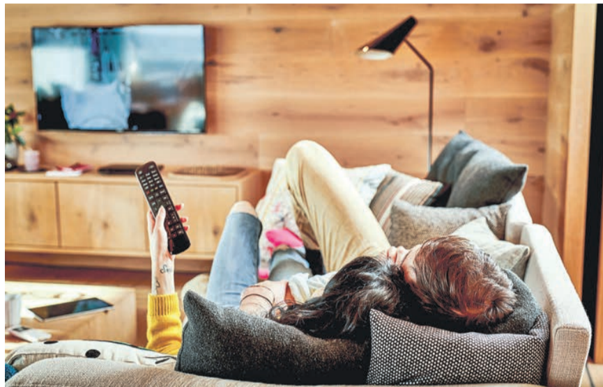
Spätestens ab dem 1. Juli 2024 können Mieter selbst ihren Kabelanbieter wählen und sind nicht mehr auf die Auswahl des Vermieters angewiesen.

Mieter können im Mietvertrag oder der Nebenkostenabrechnung nachsehen, ob Gebühren für den Kabelanschluss anfallen. Ist dies der Fall, so bringt der Wegfall des NKPs Neuerungen. Denn eine pauschale Weitergabe der Gebühren ist zukünftig ausgeschlossen.