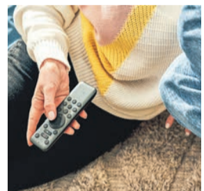
In Punkto Kabelanschluss sind wieder die Mieter selbst am Drücker.