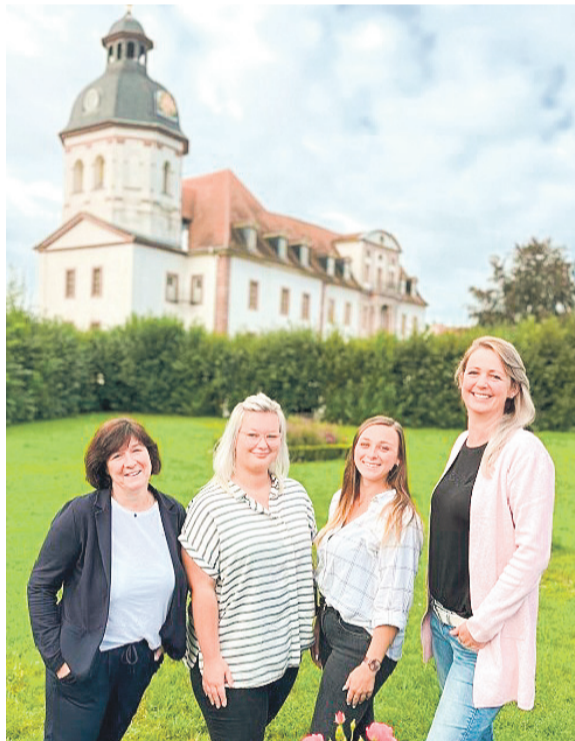
Die neuen Ansprechpartnerinnen des Landesprogramms „Agathe“ für Senioren und Seniorinnen.