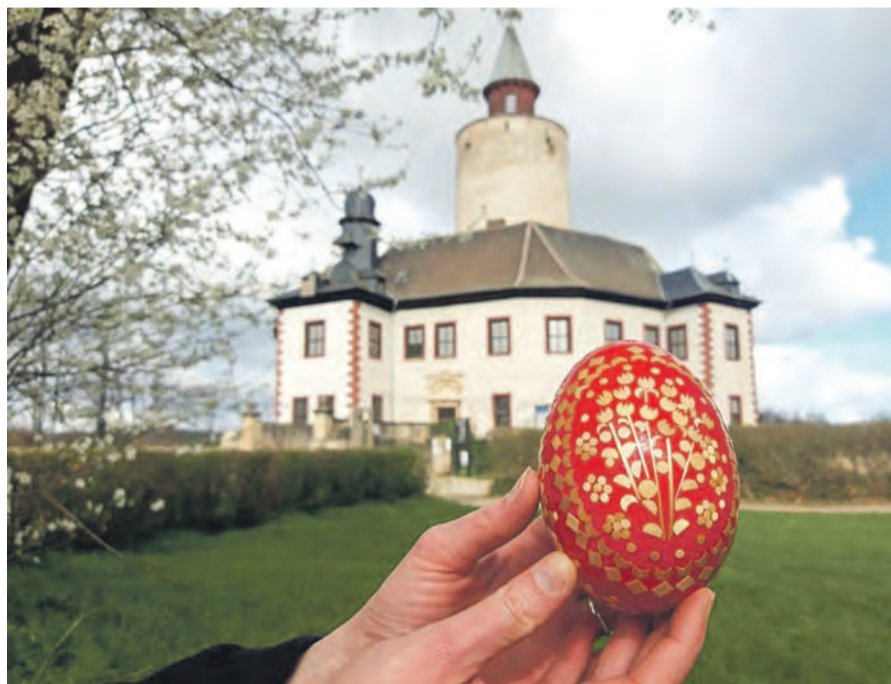
Die Burg Posterstein zu Ostern.

Posterstein. Wie wäre es mit einem Osterspaziergang von der 1000-jährigen Eiche in Nöbdenitz über den idyllischen Sprotte-Erlebnis-Pfad zur Burg Posterstein? Dort zeigt das Museum unter anderem die Ausstellung „Der Mann unter der 1000-jährigen Eiche – Über den Umgang mit faszinierenden Baumdenkmälern“. Die Burg Posterstein ist österlich geschmückt und wer genau in die Ausstellungsräume schaut, entdeckt auch einige bunt gestaltete Ostereier. Das Ganze ist vom 23. März bis zum 07. April 2024, ganztags im Rahmen der Dauerausstellung im Museum Burg Posterstein möglich