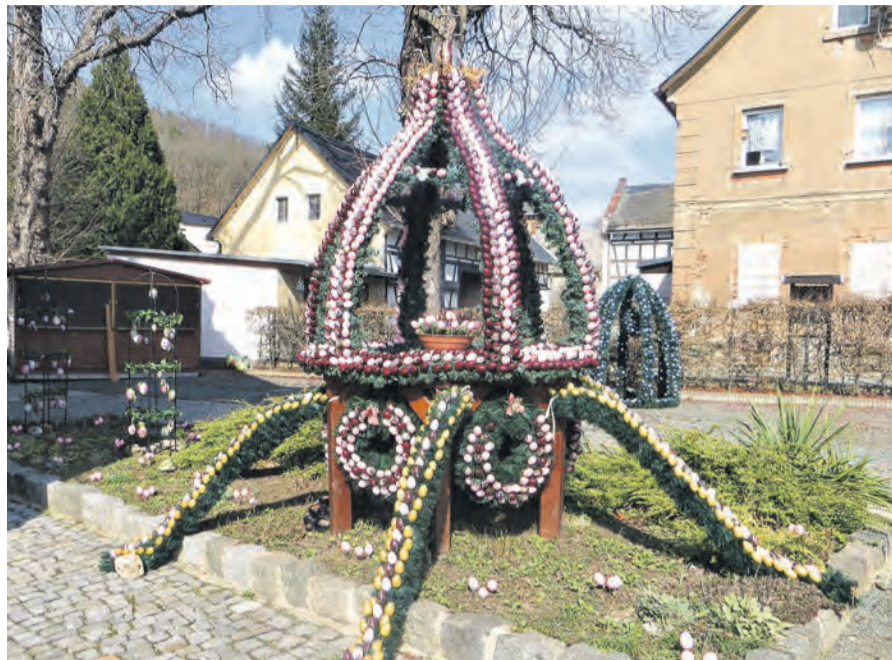
Osterkronen in Wünschendorf gegenüber vom Bahnhof