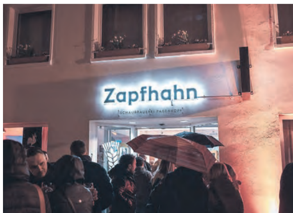
Auch wenn die Musik vorzugsweise drinnen spielt, ist die Idee durchaus verschiedene Kneipen und Gastronomien am Abend zu erleben.

in Gera etablierende jährliche Frühlingsevent. Doch die Zahlen der teilnehmenden Gastronomen sind erfreulicherweise von Jahr zu Jahr gestiegen: Über 30 Lokale der Stadt haben sich als Gastgeber für „Gera feiert frei“ registriert. Einen guten Überblick über alle Teilnehmer von A wie American Skyline Bar bis Z wie Zapfhahn und der zugehörigen Musik-Acts findet man auf der Website www.feiertfrei.de . Dabei ist der Name durchaus Programm: Für die Veranstaltungen wird kein Eintritt fällig. Sponsoren tragen die Werbekosten und auch die Stadt Gera selbst steht hinter der Kneipennacht. Wer die Gelegenheit zum freien Feiern am 13. April ab 20 Uhr nicht nutzt, ist selber schuld.