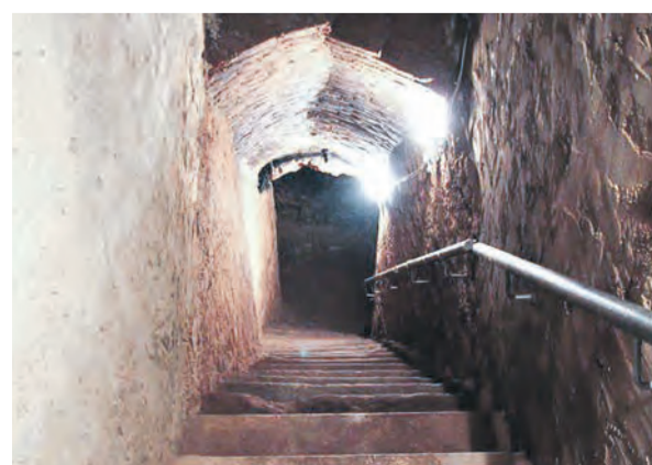
Treppe hinab in einen Höhler

Höhler e.V. selbst, als auch gemeinsam mit der Stadt in die Realität umgesetzt wurden. Teils positiv, teils nicht ganz so erfolgreich. Es gilt nun mit einer noch größeren Anzahl an Mitstreitern mehr für unsere Stadt zu tun. In einem Vortrag am 21. März um 14 Uhr im Stadtmuseum Gera werden einige Beispiele aufgezeigt, die den Einen oder Anderen zum Mitmachen bewegen sollen.