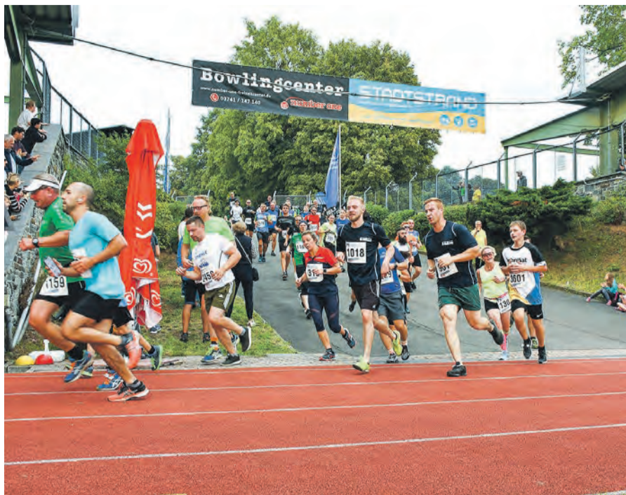
Die letzten 200 Meter auf der Tartanbahn des Vogtlandstadions sorgen für das Sieger-Feeling.

bereits um 17.40 Uhr auf die Runde begeben. Hierbei ist zu beachten, dass diese Gruppe auf maximal 500 Läufer begrenzt wird und jeder Einzelne das „Durchstarter-Ticket“ für zusätzlich drei Euro pro Person erwerben muss. „Wir wollen den ambitionierten Läufern mit der ersten Startgruppe die Möglichkeit geben, zügig und schnell den Firmenlauf absolvieren zu können. In der Vergangenheit gab es ein paar kritische Stimmen von schnellen Läufern und daher bieten wir mit dem Durchstarter-Ticket eine Möglichkeit für einen relativ ungestörten Lauf“, so Hostalka. Alle gekauften Durchstarter-Tickets werden mit Hilfe eines Aufklebers auf der Startnummer kenntlich gemacht. Nur wer das Ticket gebucht hat, kann auch in der ersten Welle starten. Die zweite Gruppe – das sogenannte Hauptfeld – wird sich dann um 17.50 Uhr am 28. August auf den Weg rund um das Vogtlandstadion begeben. Um Punkt 18 Uhr können dann alle Walker an den Start gehen und getrennt von den