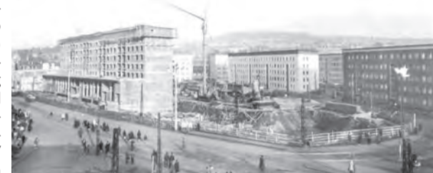
Der Geraer Handelshof 1928.

Gera. Die Ausstellung „Achtung Baustelle!“ im Stadtmuseum Gera hat sich mit bisher rund 4000 Gästen zum Besuchermagneten entwickelt. Ein Schwerpunkt in der Ausstellung bildet die Geschichte des Zentralen Platzes am Kultur- und Kongresszentrum. Die ersten Entwürfe sahen diesen Platz auf dem Gelände der Gera-Arcaden sowie eine sechsspürige Magistrale quer durch die Innenstadt vor. In den 1960er Jahren „wander-