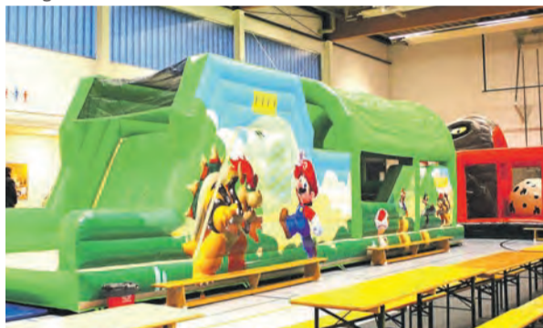
Auch bei Regenwetter lockt ein Indoorspielplatz mit wetterfesten Attraktionen.

Neben den Tierbegegnungen bietet der Erlebnispark viele weitere Attraktionen wie die Jurassic Park Aktion „Fang den wilden Dino“, bei der man zum Dinosaurier-Ranger werden kann. Dazu gibt es atemberau-