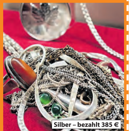
Silber – bezahlt 385 €

* ab 10 g Gold jeglicher Art OHNE WENN UND ABER!