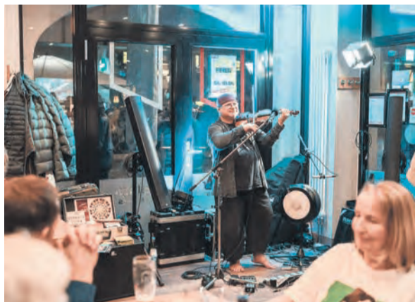
Das Motto ist Programm: „Gera feiert frei“ kostet auch in diesem Jahr keinen Eintritt.

in Gera etablierende jährliche Frühlingsevent. Doch die Zahlen der teilnehmenden Gastronomen sind erfreulicherweise von Jahr zu Jahr gestiegen: Über 30 Lokale der Stadt haben sich als Gastgeber für „Gera feiert frei“ registriert. Einen guten Überblick über alle Teilnehmer von A wie American Skyline Bar bis Z wie Zapfhahn und der zugehörigen Musik-Acts findet man auf der Website www.feiertfrei.de . Dabei ist der Name durchaus Programm: Für die Veranstaltungen wird kein Eintritt fällig. Sponsoren tragen die Werbekosten und auch die Stadt Gera selbst steht hinter der Kneipennacht. Wer die Gelegenheit zum freien Feiern am 13. April ab 20 Uhr nicht nutzt, ist selber schuld.