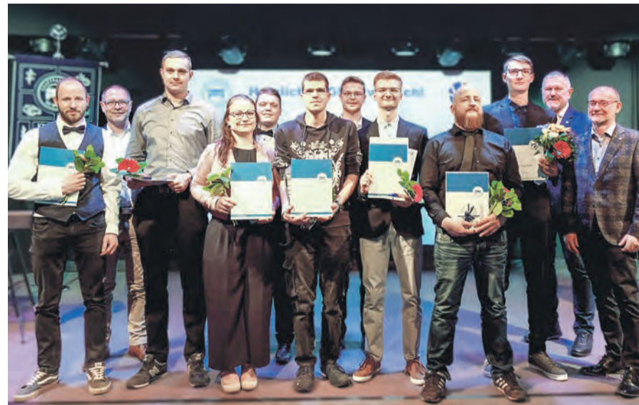
Sechs frisch freigesprochene Gesellen dürfen zum Praktischen Leistungswettbewerb der Kfz-Mechatroniker Thüringens antreten.

gische Zusammenhänge und lehrt, wie man die Balance zwischen gesunden Pflanzen und dem Schutz der Natur bewahrt. Um in diese grüne Welt einzutauchen, ist ein guter Hauptschulabschluss die Mindestvoraussetzung. Die duale Ausbildung erstreckt sich regulär über drei Jahre, wobei bei einem entsprechenden Schulabschluss oder vorheriger Vorbildung eine Verkürzung um maximal ein Jahr möglich ist. Um mehr über die Ausbildung zum Baumschulgärtner zu erfahren, empfiehlt sich ein Besuch der Webseite www.zukunftgruen.de sowie der sozialen Medien von zukunftgruen. Hier finden Interessierte detaillierte Informationen, Erfahrungsberichte und Kontaktdaten, um den ersten Schritt in eine grüne Zukunft zu wagen.