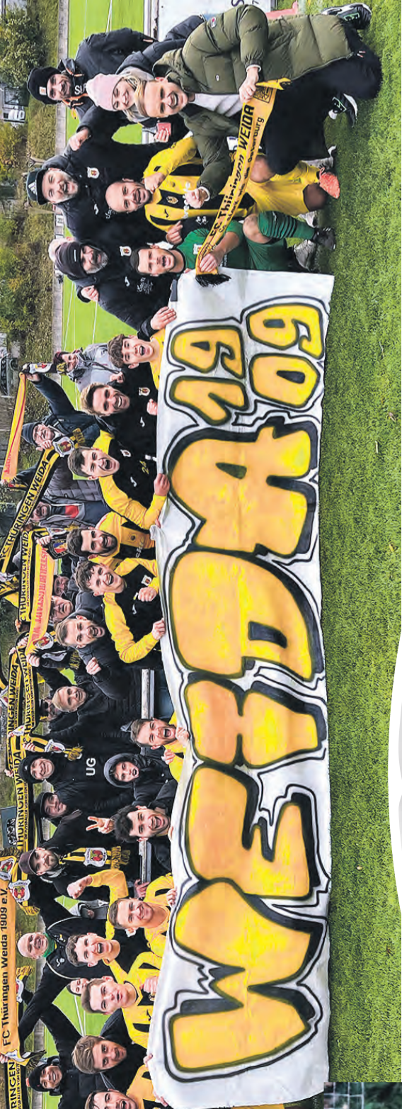
Die Weidaer qualifizierten sich mit einem 0:3 (0:0) bei TSV Motor Gispersleben zum ersten Mal für das Thüringenpokal-Halbfinale.