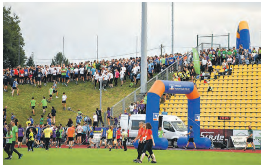
Nachdem es im Startbereich im Vorjahr zum Teil etwas chaotisch zugeht, wurde dieser 2024 im Bereich des Nachwuchstraktes verlegt - nur eine der Neuerungen für 2024.

Für die Verköstigung sorgen auch zur kommenden Veranstaltung vier Plauerer Vereine. Hostalka zeigt sich dankbar: „Dank des Caterings durch den VFC Plauen, 1. Wacker Plauen, HC Einheit Plauen und dem SV04 Oberlosa-Plauen gab es letztes Mal an 12 Grillständen erstmals keine Beschwerden über lange Anstehzeiten – damit hat unser Lauf maßgeblich an Qualität dazugewonnen, um ihn entspannt ausklingen zu lassen.“