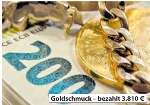
Goldschmuck – bezahlt 3.810 €

Ob Sie glänzenden Goldschmuck, wertvolle Goldbarren, exklusive Markenuhren, Zahngold, antike Münzen, eleganten Silberschmuck oder versilbertes Besteck haben, wir sind bereit, Sie umfassend und kompetent zu beraten. Lassen Sie sich nicht von der Vielfalt Ihrer Sammlung einschüchtern – ob Zahngold mit Zähnen oder nicht, wir freuen uns, es zu bewerten. Jeder Kunde, unabhängig von der Größe seines Besitzes, wird