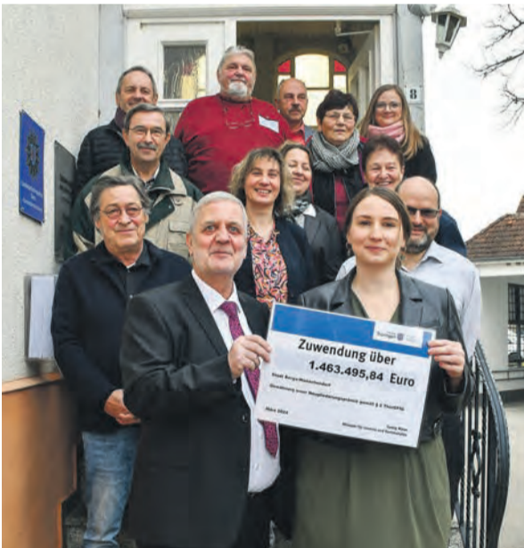
Staatssekretärin Katharina Schenk war zur Wiedereröffnung des Rathauses im Ortsteil Wünschendorf zu Gast und überreichte Bürgermeister Heinz-Peter Beyer die „Hochzeitsprämie“ in Höhe von knapp 1,5 Millionen Euro.

Berga-Wünschendorf. (gk) im Laufe des vergangenen Jahres begannen die Umbauarbeiten, weshalb die Verwaltungen vorübergehend in die Sparkassenfiliale umzog. 260.000 Euro ließ sich die Stadt Berga-Wünschendorf die Sanierungskosten, bei der größtenteils mit ortsansässigen Firmen zusammengearbeitet werden konnte. Besonders stolz ist man auf die erfolgten neuen Elektro- und Datenanschlüsse. Alle Verwaltungsangelegenheiten, Anträge und Dokumente seien nun zwischen Berga und Wünschendorf synchronisiert, freut sich Bürgermeister Beyer. Zur feierlichen Wiedereröffnung des Rathauses war am 1. März war auch Thüringens Staatssekretärin für Kommunales, Katharina Schenk, zu Gast. Als Geschenk hatte sie die sogenannte „Hochzeitsprämie“ für die Fusion im Gepäck – knapp 1,5 Millionen Euro, die unter anderem auch für Kostenerstattung an Bürger und Firmen im Rahmen der notwendigen Adressummeldungen genutzt werden sollen.