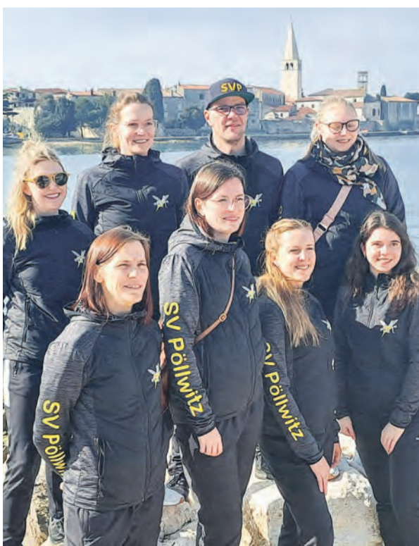
Die Mannschaft des SV Pöllwitz hier beim Rückspiel im kroatischen Porec vor malerischer Hafenukulisse.

Kunststück erneut wiederholen. Mit zwei Siegen gegen