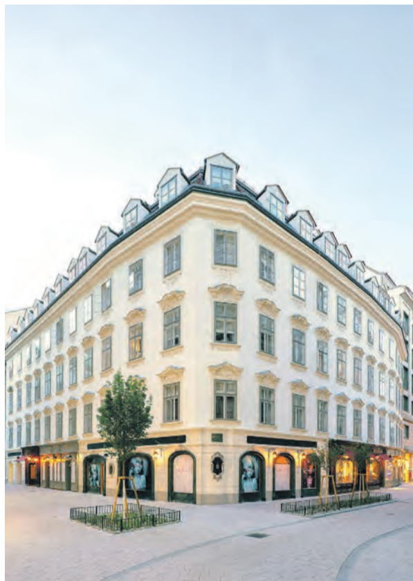
Direkt gegenüber des Wiener Stephansdoms liegt The Grand, ein außergewöhnliches Hotel, das seine Gäste auf allen Zimmern mit einem Dusch-WC verwöhnt.

Greiz. (djd-k) Viele Ferienreisende möchten im Urlaub nicht auf den gewohnten Komfort und die Hygiene verzichten. Für immer mehr Menschen gehört ein Dusch-WC, das den Po mit einem sanften Wasserstrahl gründlich reinigt, dazu. „Heute haben Urlauber eine große Auswahl an attraktiven Unterkünften, die ein tolles Ambiente, vielseitige Freizeitmöglichkeiten und eben ein Dusch-WC im Bad bieten“, sagt Martin Doerr, Vertriebsleiter für Geberit AquaClean. Er weist darauf hin, dass Urlaubslösungen mit Dusch-WC zudem eine gute Gelegenheit bieten, diese Art der Intimhygiene während der Ferien oder bei einem Städetrip ganz entspannt auszuprobieren. Unter www.geberit-aqua-clean.de/hotelsuche sind Häuser und Adressen in ganz Europa gelistet, in deren Bädern die Gäste bereits ein Dusch-WC auffinden können.