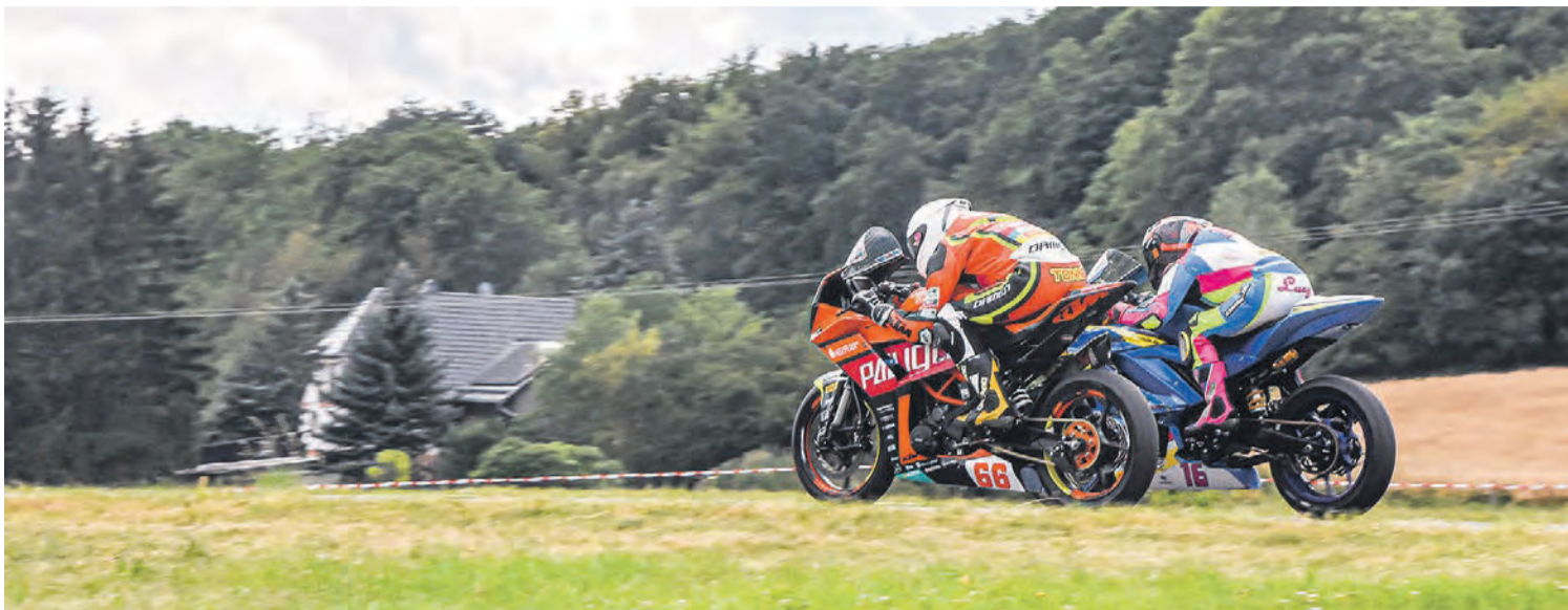
Windschattenduelle, Millimeterentscheidungen, Kurvengerangel – die IDM hat auf dem Schleizer Dreieck einiges zu bieten.

Die Internationale Deutsche Meisterschaft gastiert vom 26. bis 28. Juli auf dem Schleizer Dreieck