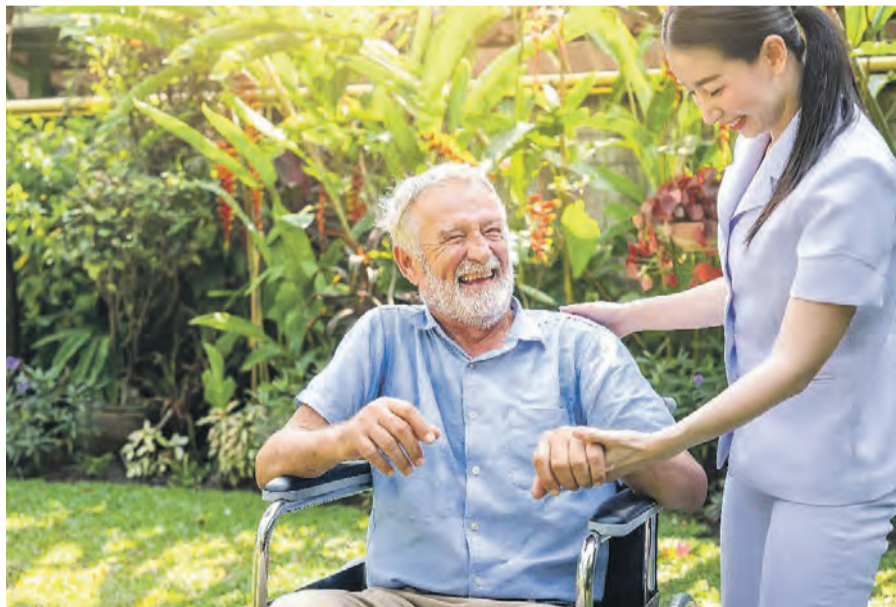
Urlaub dient der Erholung. Damit dies für Pflegepersonen ebenso wie für ihre pflegebedürftigen Angehörigen gelingt, stehen verschiedene Leistungen auch im Urlaub zur Verfügung.

Das Angebot kann genutzt werden, wenn der oder die Pflegebedürftige in Pflegegrad zwei oder höher eingestuft ist und von der Pflegeperson bereits mindestens ein halbes Jahr zu Hause gepflegt wird. Dann können Pflegebedürftige bis zu 1.612 Euro pro Kalenderjahr für bis zu sechs Wochen Verhinderungspflege erhalten. Außerdem zahlt die Pflegekasse in dem Zeitraum die Hälfte des vorher bezogenen Pflegegeldes weiter. Der Betrag für Verhinderungspflege