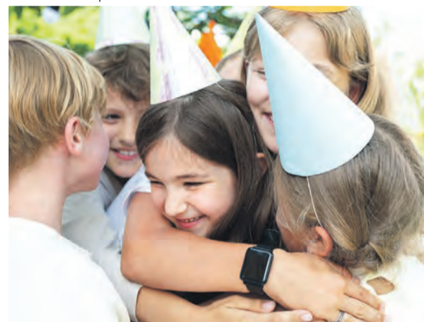
Zusammen ist Freude auf die Schule noch viel größer.

Feiern Sie zu Hause, können Sie die Einschulungsparty mit Spielen und verschiedenen Aktivitäten unterhaltsam gestalten. Engagieren Sie beispielsweise einen Clown oder Zauberer, der Ihr Kind und seine Gäste unterhält, während Sie sich ums Essen kümmern. Andere Möglichkeiten wären eine Schnitzeljagd, Karaoke, Geocoaching oder Shirts, Buttons, Armbänder, Bilderrahmen u.a.m. gestalten.