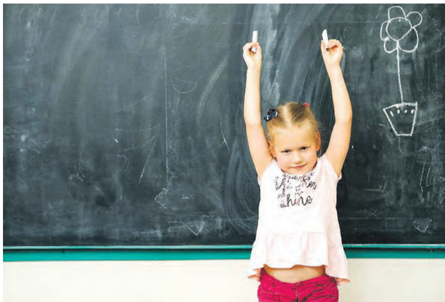
So sehr wie am ersten Schultag, freut man sich im Leben wohl nie wieder auf die Schule.

Dabei ist die Schule zumindest in der ersten Klasse heute viel spielerischer, so ernst wird es gar nicht. Außerdem sollten sich Eltern am ersten Schultag und generell in der ersten Zeit zurückhalten und das nervöse Kind nicht mit Forderungen überfrachten wie „Hör der Lehrerin zu! Sitz still! Sei leise!“. Die Eltern dürfen auch nicht die Pädagogin schlecht machen, wenn sie Negatives über sie erfahren haben. Dem Kind hilft es nicht, wenn