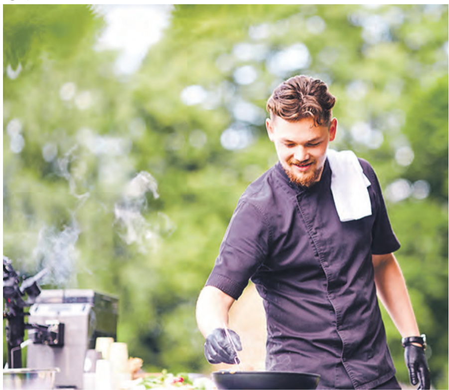
Outdoor-Küchen verwandeln sich immer mehr vom einstigen Geheimtipp zu einem Stück Lebensqualität.

So ist die Outdoor-Küche verfahrbar mit einer kleinen fahrbaren Einbauküche.