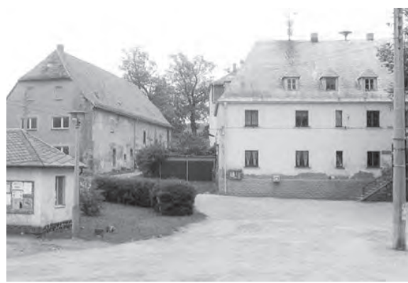
Gemeindeamt 1888.

Weitere Abgaben kamen für die Bevölkerung in Form von Markt- und Geleitgeld hinzu als Langenwolschendorf Grenzübergang wurde. Durch die Ver-