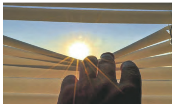
Wärme- und Kälteschutz in einem: Ein Thermo-Rollo kann im Sommer den Raum schön kühl halten und dank der Beschichtung die Sonnenwärme bereits am Fenster abhalten.

Weiterhin blocken dessen wärmeabweisenden Eigenschaften hereinströmende Hitze wirkungsvoll an der Fensterscheibe ab. Ebenso effektiv sind Rollos mit rückseitiger Aluminiumschicht, deren hitze- und kalte-reflektierenden Eigenschaften im Sommer und Winter für ein verbessertes Raumklima sorgen. Es sollte passgenau am Fenster sitzen. Bei der Montage ist zu beachten, dass diese nicht an der Wand erfolgt, sondern direkt am Fensterrahmen. Auch wenn es Thermo-Rollos in zahlreichen Farben gibt, bei der Auswahl des richtigen Transparenzgrades ist in erster Linie der Verwendungszweck entscheidend. Ist im Büro lediglich ein Hitzeschutz mit Blendschutz gewünscht, sollte ein lichtdurchlässiges Modell gewählt werden. Verdunkelnde Stoffe sind hingegen vor allem in Schlafzimmern eine gute Sache. Mit der Bundesförderung für effiziente Gebäude (BEG) profitieren Sie von energetischen Sanierungen und Förderung qualifizierter Baubegleitung zusätzlich. Informieren Sie sich über förderfähigen Sonnenschutz und profitieren von den neuen Fördermöglichkeiten BEG.