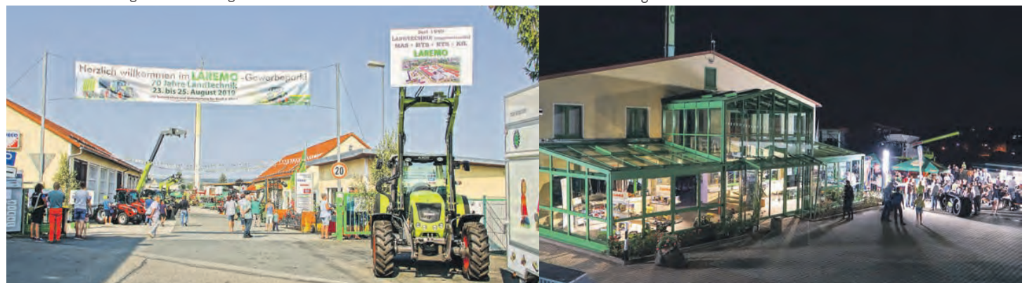
So wurde 2019 das 70-jährige Jubiläum bis in die Abendstunden gefeiert.

Ein weiteres Highlight ist ein 50-Meter-Autokran, der den Besuchern in einer Aussichtsplattform, einen traumhaften Überblick über den Unternehmensstandort verschafft. Das Team der LAREMO GmbH freut sich sehr darauf die jeweiligen Unternehmensbereiche zu präsentieren und interessierte herzlich willkommen zu heißen.