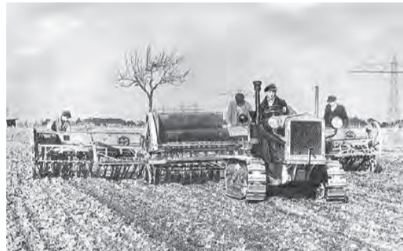
1953 – die Technik im Einsatz.