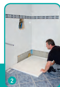
2 Duschwanne setzen