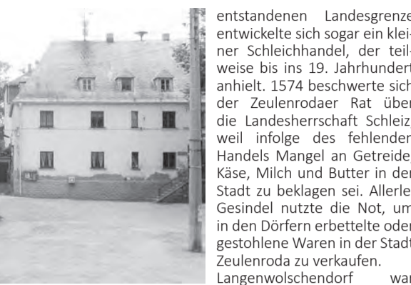
Gemeindeamt 1888.

pfändung der Stadt Zeulenroda am 27.04.1500 an die Greizer Herrschaft wurde die Stadt von ihren natürlichen Hinterland getrennt. Die bisherige Schleizer Landesherrschaft verbot nun den Bauern ihrer Dörfer nicht nur den Marktbesuch in Zeulenroda, sondern untersagte kurzerhand jeglichen Handel mit der Stadt. So durften die Zeulenrodaer Schuhmacher sonntags nicht mehr wie bisher ihre Waren vor den Kirch Türen der benachbarten Dörfer zum Ver-