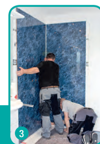
3 Rückwände stellen