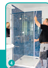
4 Duschabtrennung montieren