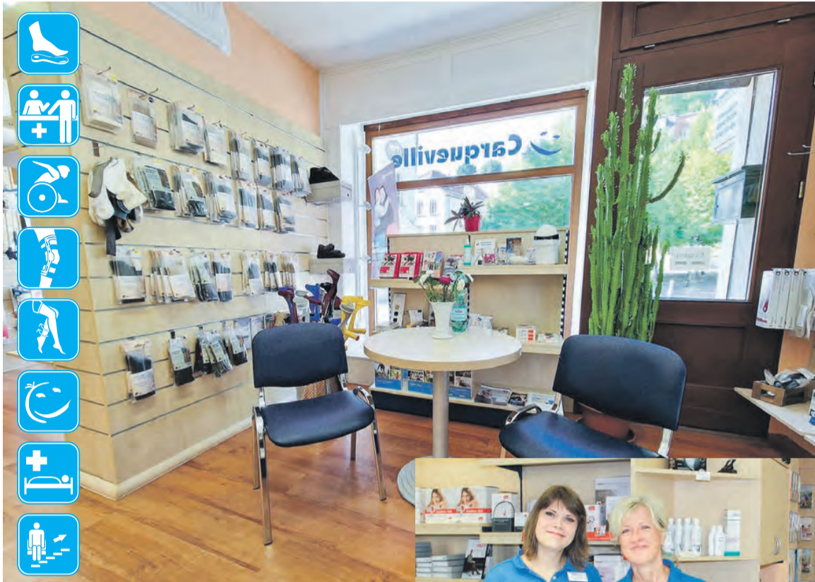
Blick in die umfangreich ausgestatteten Filialräume vom Sanitätshaus Carqueville am Von-Westernhagen-Platz 1 in Greiz.

Greiz. „Als wir im Jahr 1994 Geschäft eröffnen ist leicht! unsere Filiale in Greiz, für vier Schwer ist, es geöffnet zu hal-Jahre noch in der August-Be- ten. Nun gibt es uns in Greiz bel-Straße, eröffnet haben, – inzwischen am Von-Westernstand auf einigen Glück- hagen-Platz 1 – bereits seit 30 wunschkarten der Spruch: ‚Ein Jahren. Und ja, wir mussten