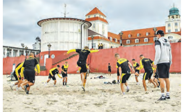
Viele Urlauber beobachteten die Trainingseinheit der Weidaer vor dem Binzer Kurhaus.

der Promenade. Nach dem Frühstück setzte sich dann das Präsidium mit allen Akteuren zusammen, um das Saisonziel zu definieren und Regeln festzulegen.