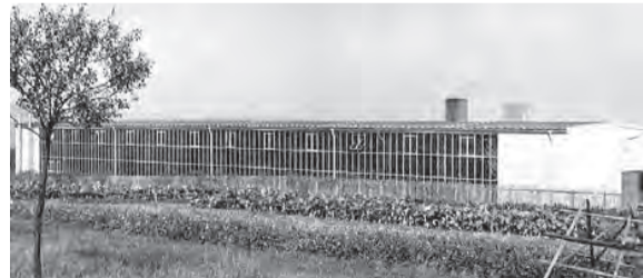
1964 wird eine neue Werkhalle fertiggestellt.