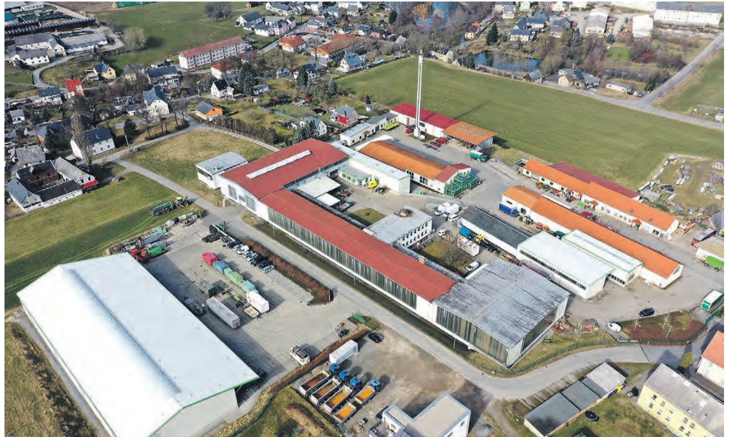
Blick auf das Gelände der LAREMO GmbH in Langenwetzendorf.