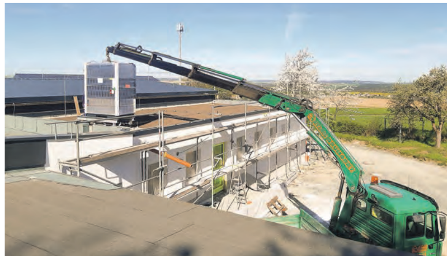
Der Aufbau der neuen Wärmepumpe im Frühjahr aufs Dach der neuen Halle.