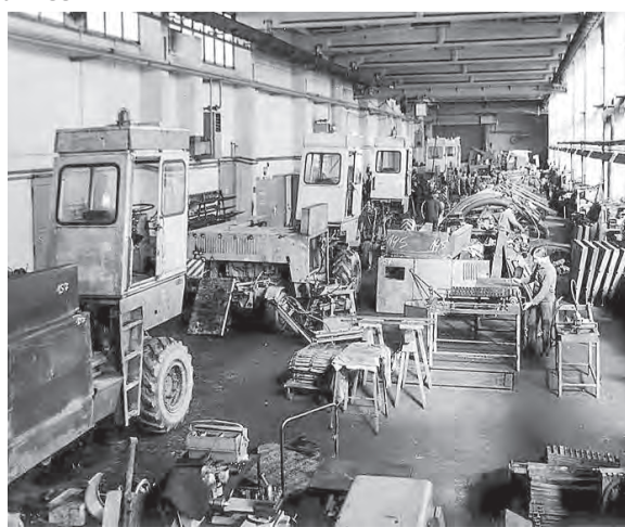
Hier wurden 1970 Häckler und Schwadmäher instandgesetzt.