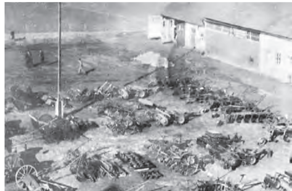
Tage der Bereitschaft 1949.