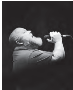
Blues-Rock-Sänger Andreas Kümmert.

werfen, Kickern und die Tischtennisbälle fliegen lassen. Das alles wird in lockerer Atmosphäre von einem DJ begleitet. Umrahmt wird das abwechslungsreiche Programm mit dem 1. Tanzstudio Plauen und einer Zwiindl-Modenschau, bei der eine Welt voller zauberhafter Dirndlkleider, die auch mit exklusiver Plauener Spitze aufwarten, präsentiert werden. Nach der Vorband „Hannah und die Mondschieber“, die ihr Publikum am frühen Abend mit akustischen Folk- und Pop-Klängen verzaubern werden, präsentieren die Stadtwerke Erdgas Plauen Samstagabend 21 Uhr als Headliner keinen Geringeren als Andreas Kümmert, der 2013 mit seiner charakteristischen Stimme aus der Show The Voice of Germany hervorging und seitdem sehr erfolgreich als Blues-Rock Sänger immer wieder für Gänsehautmomente bei seinem Publikum sorgt. Bei der Aftershowparty werden alle Hip Hop Fans auf ihre Kosten kommen. Auf Empfehlung des Teams der Alten Kaffeerösterei werden die Dip & Aufstrich Crew und Mordrake zusammen mit DJ Mille Mc Lovin die Büh-