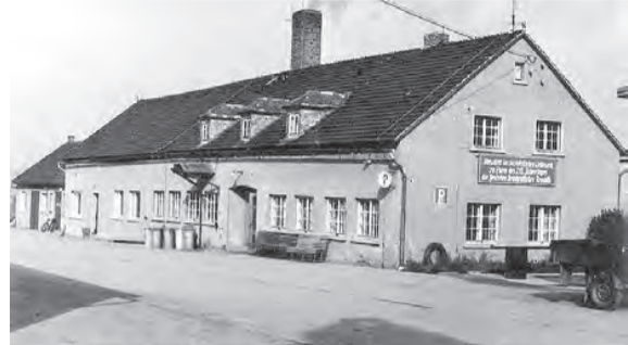
Das erste Gebäude der Maschinen-Ausleih-Station 1949 in Langenwetzendorf.