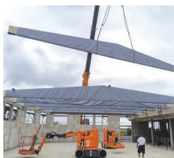
Die Halle nimmt Gestalt an und die Dachbinder werden montiert.

chem Nachfragen des Bürgermeisters, Gisbert Voigt, hatte Langenwolschendorf weder einen Ablehnungs- noch einen Zuwendungsbescheid erhalten. Vertrauensvoll hat sich die Gemeinde an Volkmar Vogel, ehemaliges Mitglied des Deutschen Bundestages, gewandt und den Zuschlag in Höhe von 90 Prozent der geplanten Kosten von 1,6 Millionen Euro erhalten. Aufgrund der enorm gestiegenen Baukosten beläuft sich der Um- und Ausbau der Turnhalle mittlerweile bereits auf über 2 Millionen, so dass die Langenwolschendorfer Gemeinde tief in die eigene Tasche greifen muss und ihre