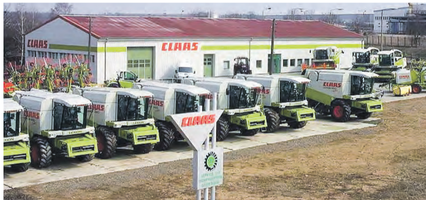
2001 erfolgte die Gründung sowie der Um- und Ausbau des Standortes Triptis.