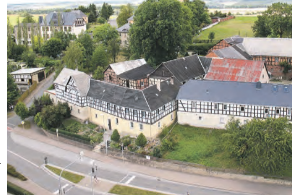
Ansicht über Langenwolschendorf und die Dorfarchitektur: Alte Fachwerk-Bauten zieren die Gemeinde entlang der Bundesstraße B94 Schleiz – Zeulenroda.

ner gemeinsam einen neuen Kindergarten, bauten den ehemaligen „Schleizer Hof“ zur Sporthalle um, erneuerten die Sportanlagen auf der „Schönen Höhe“, sicherten die Kanalisierung im Ort und legten u.a. allein im Bereich Heidestraße/Stäudigt sowie in der Hofbaute neue Siedlungen mit über 30 Einfamilienhäusern an.