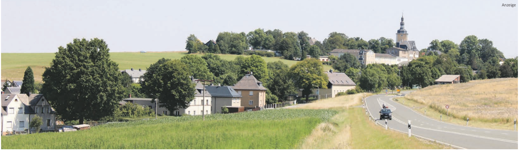
Blick auf Langenwolschendorf.