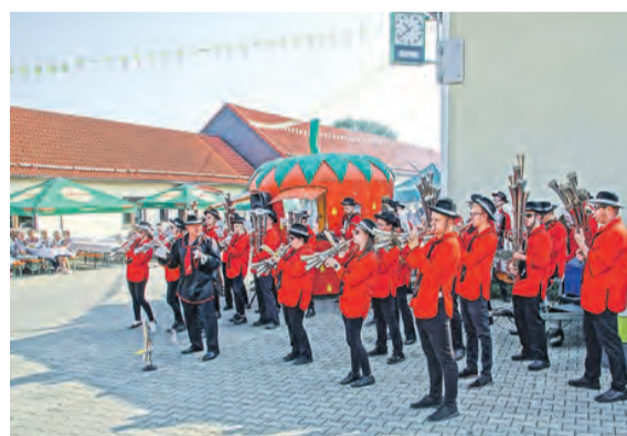
2019 wurde das 70-jährige Bestehen gefeiert.