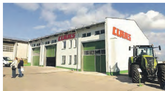
2012 wurde der Servicestützpunkt Bucha bei Jena eröffnet.