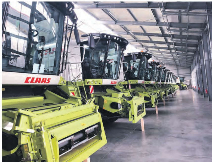
2016 wurde die große Maschinen-Ausstellungshalle fertiggestellt.