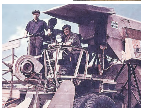
Erster Mähdescher E175 trifft 1955 in Langenwetzendorf ein.

- MTS - RTS - KfL - LAREMO GmbH“ am Standort Langenwetzendorf Umbau der Betriebskantine zur LAREMO Gaststätte