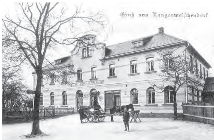
Der Schleizer Hof früher und heute. Er wurde aktuell zur Turnhalle umgebaut. Abends ist die Turnhalle vor allem von den unzähligen Sportvereinen Langenwolschendorfs ausgelastet.