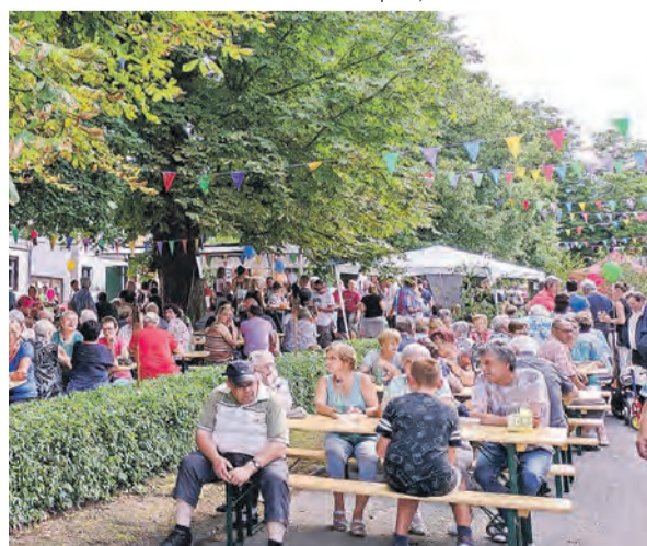
Geschichtliches, Tanz, Musik und verschiedene Wettkämpfe – Vorfreude auf das Lindenfest in Liebengrün.

Historie und Fakten von Liebengrün in Stichpunkten - erste urkundliche Erwähnung 1377, vermutlich jedoch älter - es war ein freies Dorf mit Privilegien, welches viele Neider auf sich zog - besondere Anlage der Häuser als Angerdorf mit teilweise verzierten Fassaden der Häuser