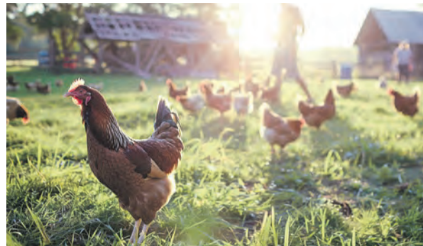
Frisches Obst und Gemüse wie auch Tierprodukte aus regionalem Anbau findet man in den Hofläden.

Der Besuch beim heimischen Hof lohnt nicht nur wegen der hochwertigen regionalen Produkte, sondern hat für Jung und Alt auch einen hohen Erlebniswert. Gehen Sie auf Genusstour durch die Region und besuchen Sie Ihre landwirtschaftlichen Erzeuger von nebenan.