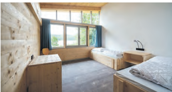
Blick in eines der neuen Gästezimmer.