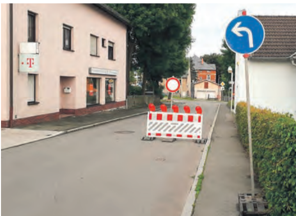
Die Umleitung Richtung Augasse endet 100 Meter weiter am Sperrschild.