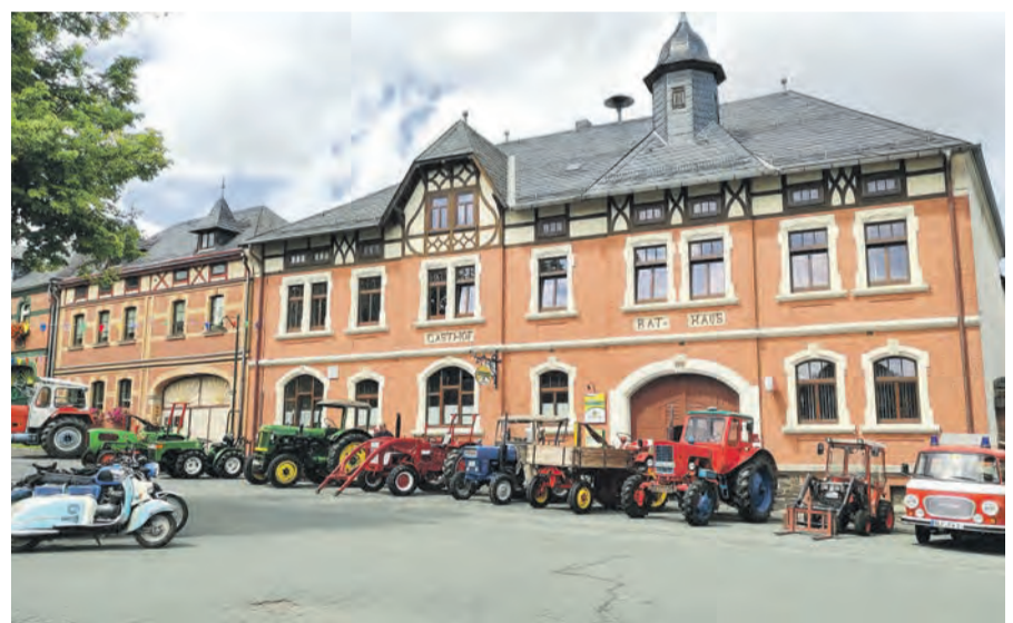
Zeigen auch Sie Ihre „alten Schmuckstücke“ auf der historischen Fahrzeugausstellung am Marktplatz in Liebengrün.

- am 13. Oktober 1906 kam es zu einer großen Brandkatastrophe, bei der 21 Wohnhäuser