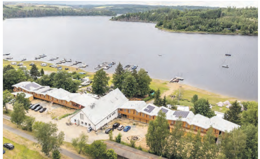
Blick auf das neugestaltete Seesport- und Erlebnispädagogische Zentrum in Kloster.

Bauplanungen, Verzögerungen durch Corona-Pandemie, Energiekrise, Inflation usw. als schwierig. Daher erfolgte der gemeinsame Spatenstich vom Landessportbund Thüringen als Bauherr, der Internationalen Bauausstellung Thüringen GmbH (IBA) und dem Thüringer Forst erst im März 2022 für den Um- und Neubau, die Baumaßnahmen begannen im Spätherbst. Es waren rund 15 verschiedene Gewerke in unterschiedlichem Umfang beteiligt. Allerdings gab es zwei Hauptakteure, um den Fokus „nachhaltiges regionales Holzbauprojekt“ zu realisieren – die Rettenmeier Holzindustrie Hirschberg GmbH/Großsägewerk Rettenmeier und die Holzbaufirma Pfeiffer aus Burglemnitz – in Kooperation mit dem Thüringer Forst. Am 14. Juni 2024 fand die offizielle Eröffnung statt. Inhaltlich-pädagogisch betreut die Thüringer Sportjugend das SEZ als „Bildungs- und Freizeitstätte der Thüringer Sportjugend im LSB Thüringen e.V.“ Mit zwei komplett neuen Holzanbauten, in denen sich die Gästezimmer und Seminarräume befinden, und einer neu gestalteten Bootshalle erwarten Sportvereine, Verbände, Klassen und Trainingsgruppen nun 99 Betten in lichtdurchfluteten Zimmern, zwei große Seminarräume und viele tolle Highlights, um einen unvergesslichen Aufenthalt am Ufer des Bleilochstausees zu garantieren. Neben den neuen Unterkünften stehen vielfältige Programme und Angebote im Plan. Der Fokus liegt weiterhin auf Bildung, Erlebnis sowie Bewegung und bezieht die