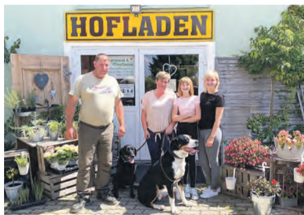
Familie Bannasch vor dem Hofladen in Langenwolschendorf

Seit 2022 haben wir einen 24/7 Automaten, an diesem können unsere Kunden rund um die Uhr, auch nach Ladenschluss sowie an Sonntagen, unsere Produkte erwerben. Dies ist eine perfekte Ergänzung zu unserem Laden und ermöglicht es unseren Kunden, jederzeit frische Produkte zu kaufen,“ so Familie Bannasch.