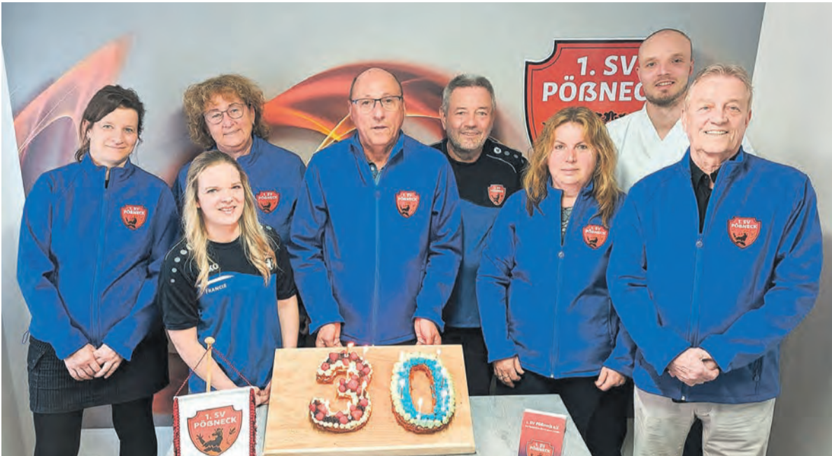
Gruppenbild vom Trikottag – der Kreissportbund feierte am 13. April sein 30-jähriges Bestehen.