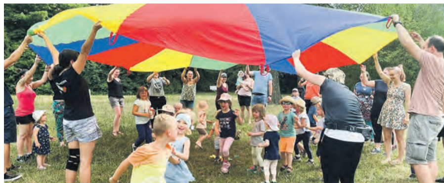
Beim Eltern-Kind-Turnen können schon die Kleinsten unabhängig von Wind und Wetter die Welt erkunden. Singen, spielen, freie Bewegungslandschaften und Kleingeräte ermuntern die Kleinen zu Spiel und Bewegung an der Seite von Mami und Papi.