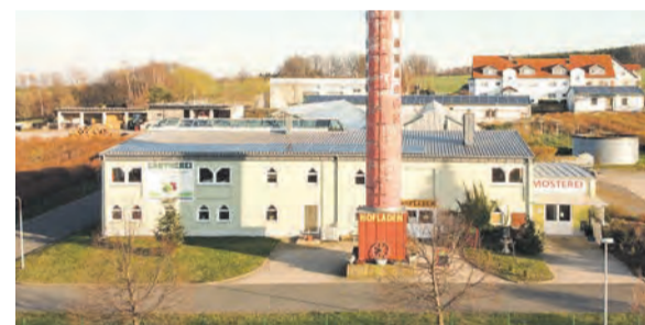
Der Landwirtschaftliche Betrieb umfasst eine Gärtnerei, einen Hofladen, eine Mosterei sowie eine große Heidelbeerplantage.