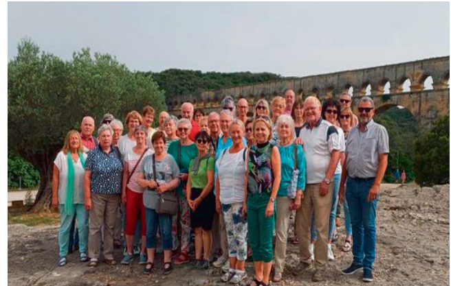
Impression: Bildungsreise Provence Juni 2024