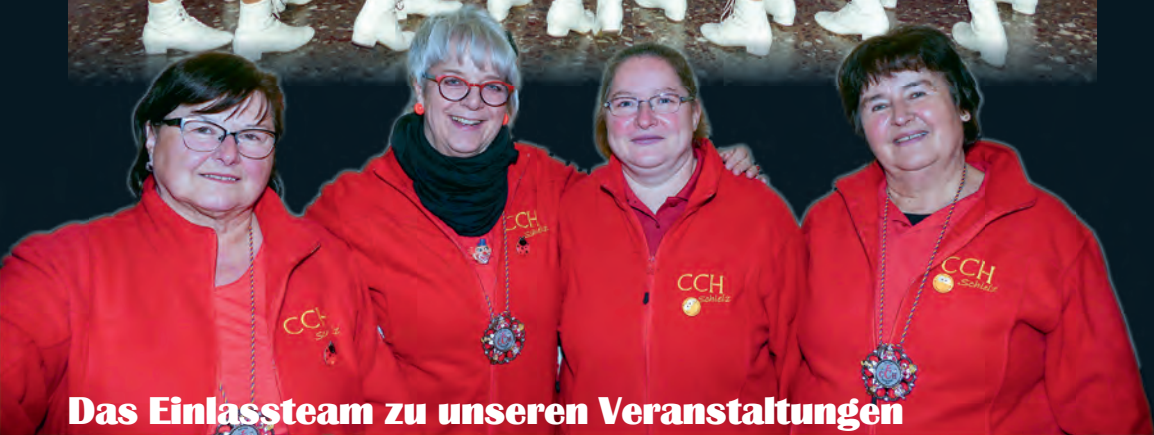
Das Einlassteam zu unseren Veranstaltungen