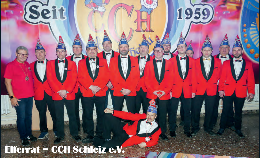
Elferrat – CCH Schleiz e.V.