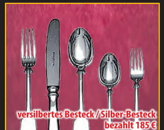
versilbertes Besteck / Silber-Besteck bezahlt 185 €