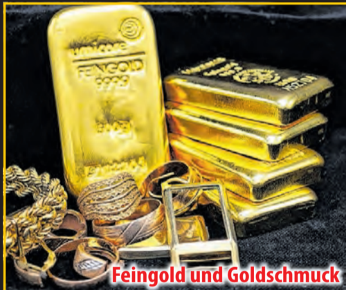
Feingold und Goldschmuck