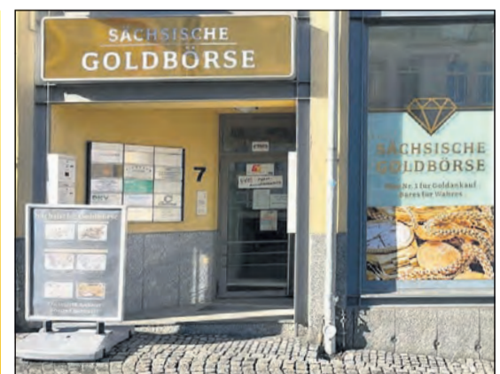
Oberer Steinweg 7 (gegenüber der Commerzbank / neben Reisedienst Kaiser)