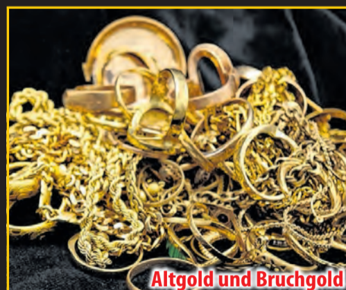
Altgold und Bruchgold