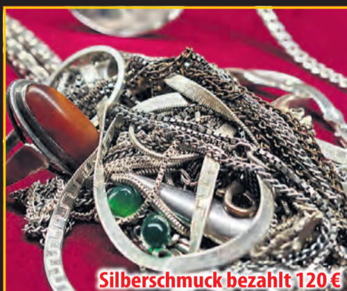
Silberschmuck bezahlt 120 €