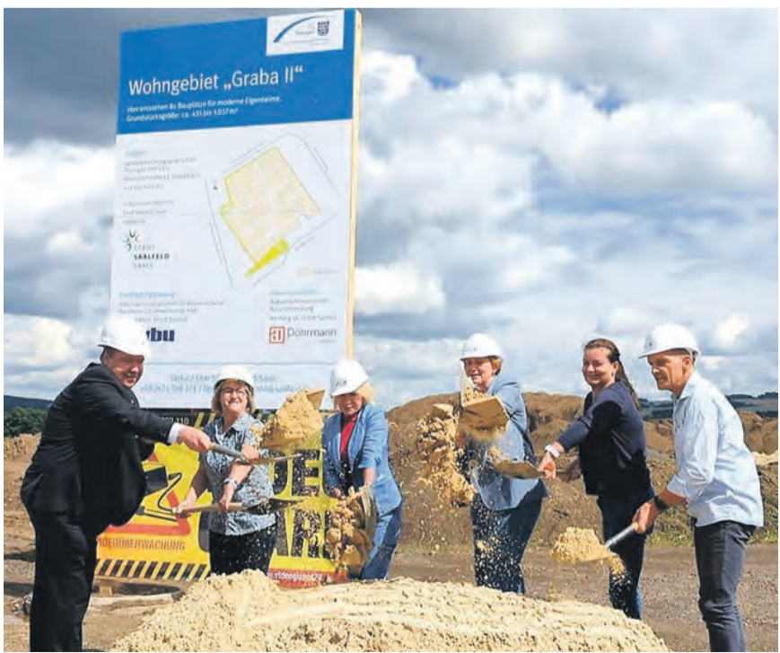
Der Spatenstich für „Graba II“.

Zielen des Flächennutzungsplanes trat der Bebauungsplan für den 2. Bauabschnitt im Oktober 2020 in Kraft. Bis die Bagger dann rollen konnten, war es ein langer Weg. Zunächst musste die Entwässerung durch den Ausbau des Hauptsammlers vom ZWA Saalfeld-Rudolstadt sichergestellt werden. Zudem war ein aufwendiges Planungs- und Umlegungsverfahren erforderlich. Hier ging es um eine neue Sortierung des in sehr kleinteiligem Besitz befindlichen Gebietes. Im vergangenen Jahr haben die Archäologen das Gebiet erfolgreich untersucht, und kürzlich wurde die Kampfmittelsondierung abgeschlossen.