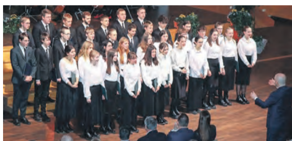
Das Festprogramm gestalteten die Thüringer Symphoniker sowie die Sängerknaben und der Mädlerchor Saalfeld.