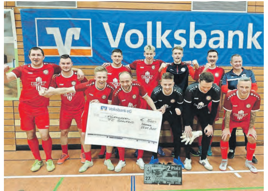
Am ersten Freitag des neuen Jahres nahmen die Männer zum ersten Mal am Rennsteigpokal in Neuhaus teil. Das von der SG Lauscha/Neuhaus bestens organisierte Hallenturnier lieferte spannende Begegnungen auf hohem Niveau. Am Ende belohnten sich die Saalfelder mit dem zweiten Platz und mussten sich lediglich dem FC Coburg im Finale geschlagen geben. Alles in allem also ein gelungener Start ins Fussballjahr 2025.