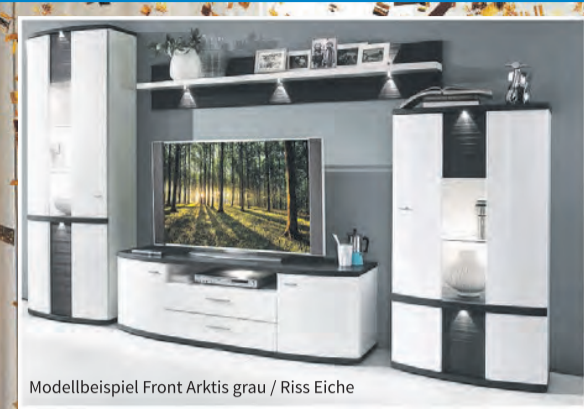
Modellbeispiel Front Arktis grau / Riss Eiche

Schaffen Sie Platz für Kreativität und puren Wohn-Komfort. Entdecken Sie Möbel, die Ihrem Leben Raum geben. Jetzt in Oppurg!