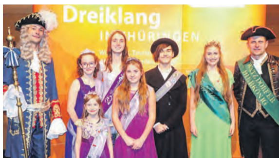
Symbolfiguren der Städte: Rudolstädter Hofmarschall, Bad Blankenburgs Lavendelkönigin mit Prinzessinnen sowie der kleine Fröbel, die Saalfelder Grottenfee und Watzdorfs Bierkönig (v.l.).