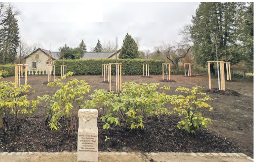
Auf dem Hauptfriedhof der Stadt Saalfeld/Saale können ab 1. Januar 2025 Baumbestattungen vorgenommen werden.