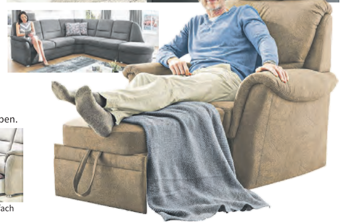
geräumiges Staufach (Aufpreis)