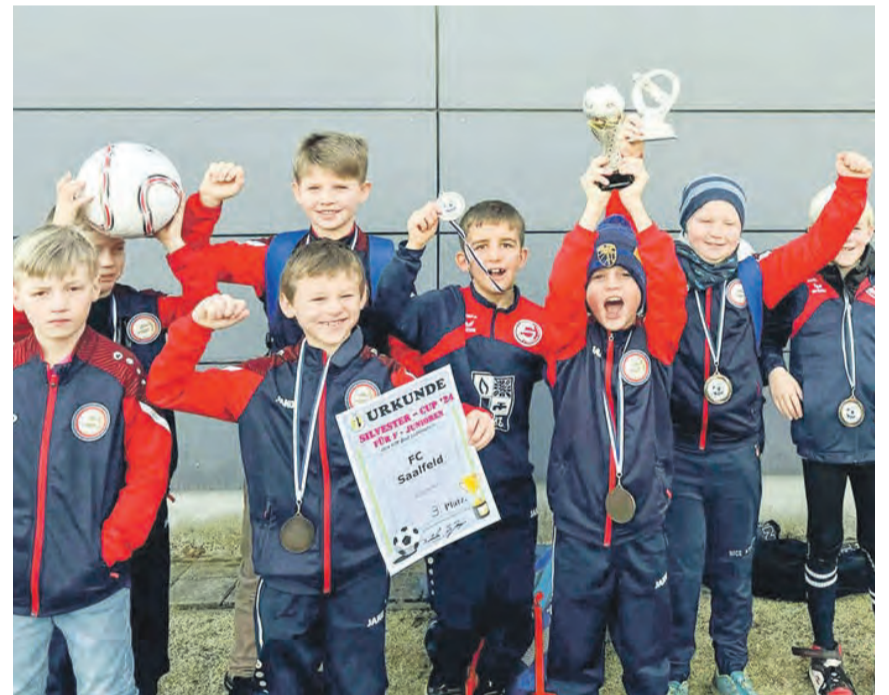
Die U10 startet mit zwei erfolgreichen Turnieren in ihre Hallensaison. Insgesamt haben die Trainer in dieser Winterperiode neun Turnierteilnahmen geplant. Dabei könnten noch weitere Turniere folgen, je nachdem wie die Hallenkreismeisterschaften verlaufen. Beim Silvestercup belegte die U9 den dritten Platz.