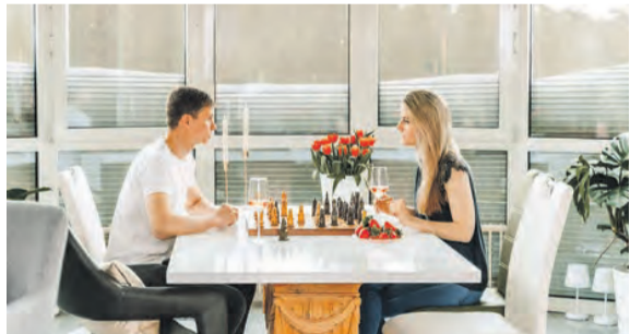
Rollläden und Co. passen sich inzwischen an nahezu jede Fensterform an und bieten auch bei großzügigen Fensterflächen den nötigen Sichtschutz.

und Farben“, weiß Steffen Schanz vom gleichnamigen Hersteller aus dem Schwarzwald. Neben der Optik ist bei der Auswahl der passenden Beschattungslösung auch die Funktion wichtig. Unter www.rollladen.de gibt es mehr Expertentipps. Immer beliebter werden Sonnenschutzsysteme mit Lichtschienen, die auch in geschlossenem Zustand dosiertes Sonnenlicht in die Wohnräume lassen.