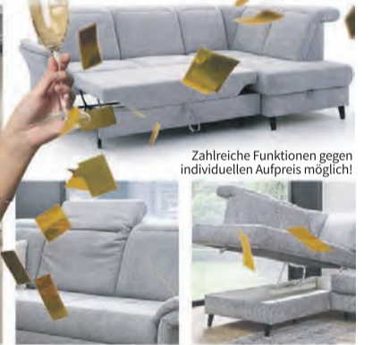
Zahlreiche Funktionen gegen individuellen Aufpreis möglich!

GARNITUR VAREL , Stoff Orlean (PG Basic), Farbe grau, Rücken echt, Nähte Ton in Ton, Federkern, Fuß-Variante 1 (12 cm) Metall schwarz matt, Sitzhöhe 48 cm, Sitztiefe 56 cm, Stellmaß ca. 253 x 185 cm, ohne Funktion (nicht im Werbepreis enthalten), ab