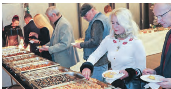
Danach ging es ans Büffet.