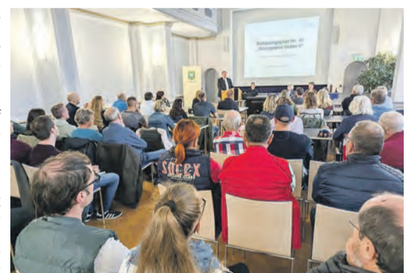
Das neue Wohngebiet „Graba II“ stand am 22. Oktober 2024 im Fokus einer Informationsveranstaltung im Bürger- und Behördenhaus in Saalfeld.

gen werden. Nach Abschluss des Umlegungsverfahrens, voraussichtlich im Februar 2025, können notarielle Kaufverträge geschlossen werden. Käufer sind verpflichtet, das Grundstück innerhalb von fünf Jahren mit einem dem Bebauungsplan entsprechenden Wohngebäude zu bebauen. Die Stadt will so sicherstellen, dass die Grundstücke zügig bebaut werden. Denn: Solange die Grundstücke in Graba II nicht bebaut sind, darf Saalfeld keine neuen großen Baugebiete für Einfamilienhäuser ausweisen. „Nach langer Zeit erschließen wir mit Graba II wieder ein großes Saalfelder Baugebiet für Ein- und Zweifamilienhäuser. Die Schaffung von Einfamilienhaus-Bauflächen ist wichtig, um jungen Familien in der Stadt zu halten“, verdeutlicht Bürgermeister Dr. Steffen Kania und ergänzt: „Wir stehen mit den Nachbarstädten Jena, Weimar und Erfurt im Wettbewerb um die besten Köpfe. Daher brauchen wir Bauplätze. Denn Fakt ist, dass junge Familien auch in der aktuellen Krise Wohneigentum wollen.“ Das neue Wohngebiet soll ein neuer „grüner Stadtteil“ von Saalfeld werden. Bäume sollen gepflanzt werden, eine Streuobstwiese soll entstehen. Am Rand des Wohngebiets entsteht ein Erdwall zum Schutz vor Lärm, der laut der