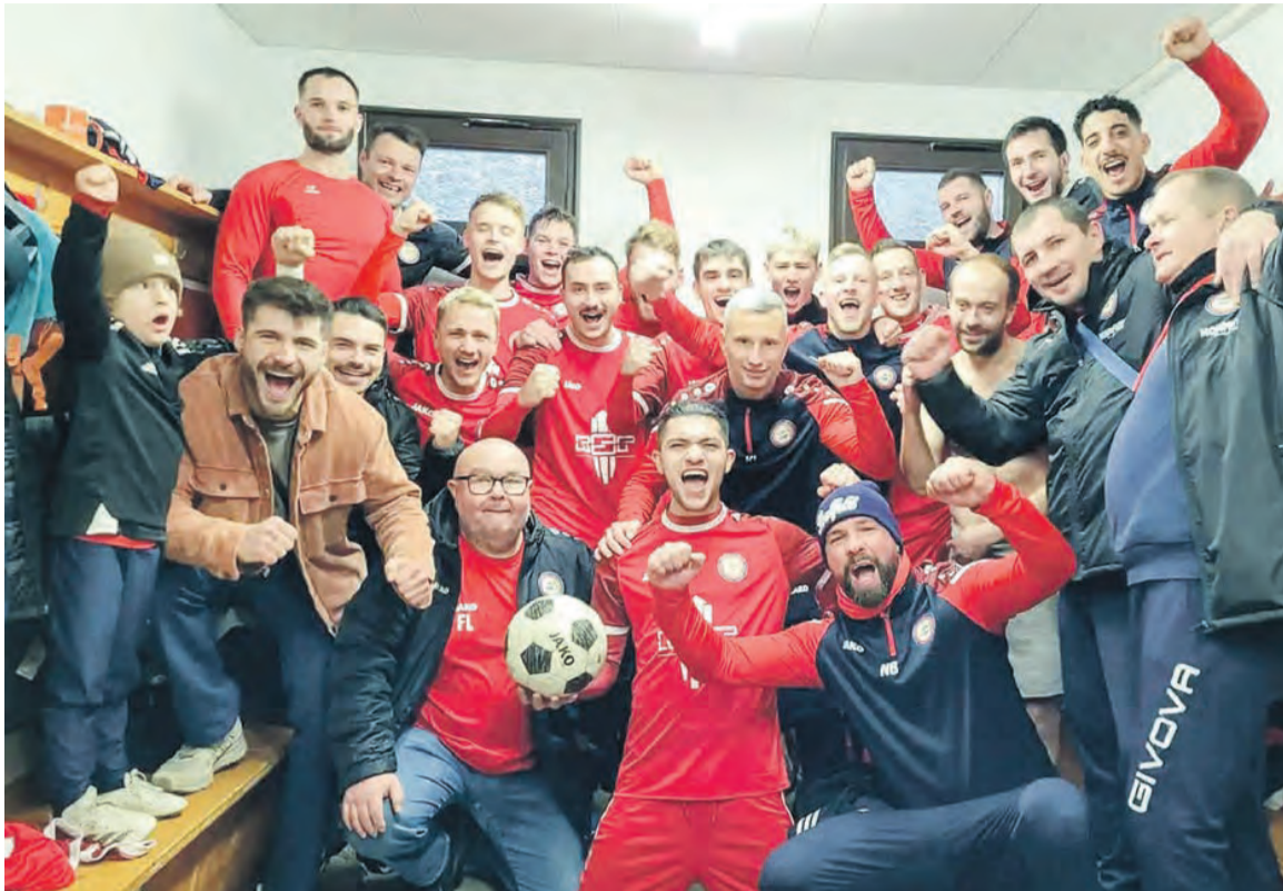
Der Jubel ist groß. Mit dem Sieg im letzten Hinrundenspiel hat der FC Saalfeld die Abstiegsränge vorerst verlassen und sich eine gute Ausgangsposition für die Rückrunde erarbeitet.

Saalfeld. (Herbert Uhlmann) Mit der roten Laterne verbrin- gen müsste. Gegen eine junge und starke Gästeelf (Durchschnittsalter: 21,1 Jahre), die ihr Punktekonto gegen die ab- stiegsgefährdeten Gastgeber aufbessern wollte, entwickelte sich ein ausgeglichenes Spiel. Es war eine kampfbetonte, aber faire Partie mit leichten