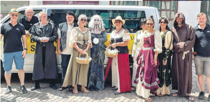
Mit dabei, beim großen Jubiläums-Stadtfest in Calw.