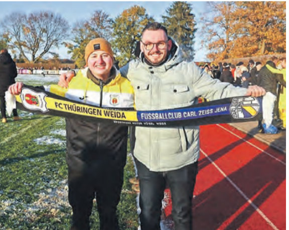
Zwei treue Anhänger des FC Thüringen Weida zeigen Flagge und feiern ihre Mannschaft bei winterlicher Kulisse.

einandertreffen, knistert die Luft. Die Spieler wissen, was auf dem Spiel steht, und die Zuschauer sowieso. Es wird laut, es wird emotional, es wird Derby. Doch damit nicht genug: Im Anschluss an das Spiel verwandelt sich der Sportpark in ein kleines Open-Air-Kino. Auf dem Platz wird eine große Leinwand aufgebaut, auf der in entspannter Atmosphäre ein Film gezeigt wird. Ein Angebot für alle Fußballfreunde, die den Abend gemütlich und gemeinschaftlich ausklingen