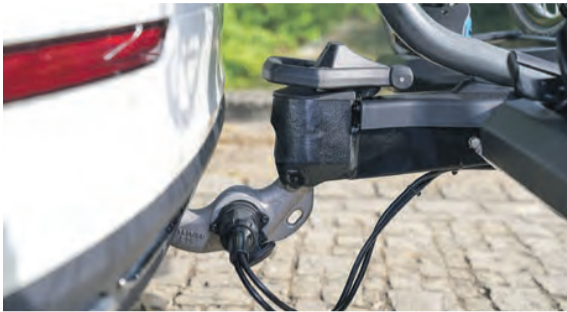
Sicherer Halt mit einem Handgriff: Zwei Pins unterhalb des Kugelkopfs und die passende Aufnahme am Fahrradträger sorgen für eine präzise, spielfreie Verbindung.

Greiz. (djd) Urlaub auf zwei Rädern boomt: 37,4 Millionen Menschen in Deutschland benutzten laut der ADFC-Radreiseanalyse 2024 ein Fahrrad im Urlaub und für Ausflüge – das ist mehr als die Hälfte der Erwachsenen. Natürlich möchte man auch im Urlaub am liebsten das eigene Rad, mit dem man im Alltag vertraut ist, weiterverwenden. Doch wie gelingt es stressfreier und vor allem sicherer Transport ans Ziel? Wer das Fahrrad oder E-Bike huckepack mit dem Auto befördern möchte, hat einige grundlegende Dinge zu beachten, beispielsweise beim Fahrverhalten. Zudem dürfen Rücklichter, Bremsleuchten und Kennzeichen niemals verdeckt sein, vielfach ist ein zusätzliches Kennzeichen für den Fahrradträger erforderlich.