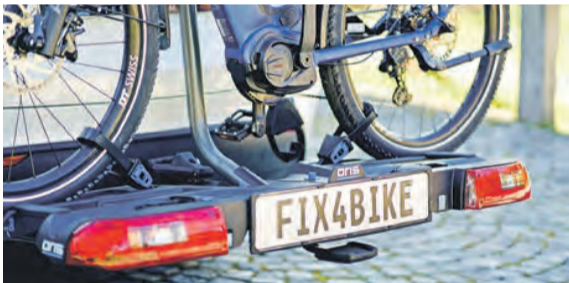
Tests beispielsweise des ADAC bestätigen die einfache und schnelle Montage des Systems.

und gleichzeitig verklemt werden – kein leichtes Unterfangen. Dabei gibt es heute einfache und sichere Lösungen wie das Adaptersystem Fix4Bike der Marke Oris. Dank einem speziell konstruierten Kugelhals mit zwei Bolzen unterhalb des Kugelkopfs und passender Aufnahme am Fahrradträger sorgt es für eine präzise, spielfreie Verbindung – mit nur einem Handgriff, ohne Nachjustieren. Fahrradträger mit der patentierten Aufnahme werden oberhalb der Kupplungskugel positioniert und einfach abgesenkt, bis sie hörbar mit einem Klick automatisch einrasten. Einmal montiert, sitzt der Fahrradträger