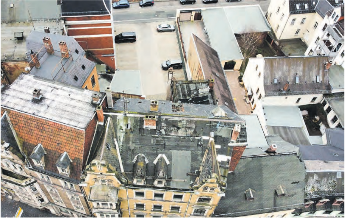
Bruno-Bergner-Straße 2, Greiz

Greiz. (Interessengemeinschaft Greizer Neustadt e.V.) Die Interessengemeinschaft Greizer Neustadt e.V. wendet sich mit einem offenen Brief an die Stadtverwaltung Greiz und Bürgermeister Alexander Schulze, um auf ein akutes städtebauliches Problem aufmerksam zu machen: den dramatischen Verfall des Gründerzeitgebäudes in der Bruno-Bergner-Straße 2, vormals Heinrichstraße. Dieses architektonisch bedeutende Gebäude ist ein markantes Zeugnis unserer Stadtgeschichte und steht kurz davor, für immer zu verschwinden. Der aktuelle Zustand des Hauses ist erschreckend. Risse in der Fassade, massive Schäden am Dachstuhl und eine stetig voranschreitende Verwahrlosung gefährden nicht nur die bauliche Substanz, sondern auch das Umfeld. In einer gemeinsamen Besprechung im Rathaus haben Vertreter der Interessengemeinschaft mit Bürgermeister Alexander Schulze und dem Ordnungsamt die Sachlage eingehend erörtert. Die Stadt bemüht sich bereits seit Jahren, den im Ausland lebenden Eigentümer zur Verantwortung zu ziehen, bislang erfolglos. Eine akute Gefahrenlage könnte bald Gegenmaßnahmen des Landkreises erforderlich machen, doch bis dahin sind den Behörden aufgrund gesetzlicher Vorgaben die Hände gebunden.