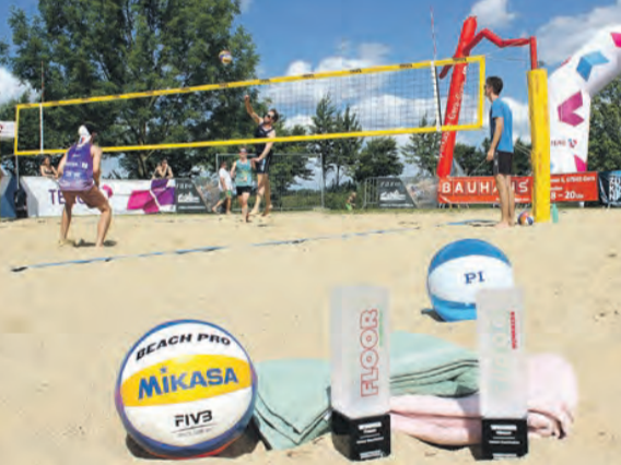
Beachvolleyball im Freibad

Weida. (Stadtverwaltung Weida) Am Samstag, dem 2. August 2025, verwandelt sich das Freibad Weida in eine sommerliche Erlebniswelt für Groß und Klein. Der 3. Familientag im Rahmen des Beachfestivals verspricht Spiel, Sport und Spaß für die ganze Familie. Los geht es ab 9 Uhr mit dem Beachvolleyballturnier um den PI Ceramic Cup – Anmeldungen sind per E-Mail an m.roby.funke@gmx.net möglich. Ab 11 Uhr startet das große Kinderfest mit Hüpfburgen, Bastelstraße, Modelleisenbahn, Ballonmodellieren und vielem mehr. Ab 13 Uhr sorgen lustige Poolspiele – von der Pool-Disco über Wetttruschen bis zur Wasserlaufbahn – für Abkühlung und Action im Wasser.