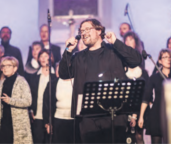
Gospelchor „LIVING TONES“ aus Triebes

Aumaischen Straße 30-32. Fr 9–16 Uhr, Do 9–18 Uhr, Sa/ Die Öffnungszeiten sind: Mi/ So 13–17 Uhr.