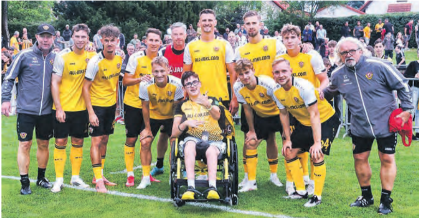
Die Mannschaft des FC Thüringen Weida mit einem jungen Fan nach dem Spiel gegen Dynamo Dresden, ein emotionaler Moment für alle Beteiligten.

Für den FC Thüringen Weida war dieses Testspiel ein Höhepunkt des Jahres 2025. Es gab nicht nur sportlich viel zu lernen, sondern auch deutlich zu spüren, welche Kraft in Zusammenarbeit und Gemeinschaft steckt. Der FC Thüringen Weida bedankt sich ausdrücklich bei allen Helfern, Partnern und Unterstützern. Zum Schluss sei gesagt: Auch wenn das Spielergebnis klar war, bleibt das Erlebnis für Weida und Thüringen unvergessen.