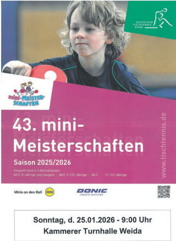
Bei der Tischtennis-Mini-Meisterschaft kämpfen auch schon die Jüngsten um vordere Plätze.

Die Tischtennis-Mini-Meisterschaft findet am Sonntag, 25. Januar 2026, ab 9 Uhr in der Kammerer-Turnhalle in Weida statt. Ausgerichtet wird die nunmehr 34. Auflage vom TUS Osterburg 90 Weida, Abteilung Tischtennis, gemeinsam mit der Stadtverwaltung Weida (Sachbereich Kita/Jugend/Sport). Die bundesweit durchgeführte Aktion wird vom Deutschen Tischtennis-Bund gefördert und in Weida besonders durch die Volksbank eG Gera Jena Rudolstadt unterstützt. Auf die Sieger warten Pokale, Medaillen und weitere Preise. Zudem erhält jeder Teilnehmer eine Urkunde. Die besten Vier können sich über weitere Entschiede bis zum Bundesfinale qualifizieren. Gespielt wird zunächst in Gruppen „Jeder gegen jeden“ in den Altersklassen bis 8 Jahre, bis 10 Jahre sowie 11/12 Jahre. Danach werden die Stadtmeister 2026 der Mädchen und Jungen im K.-o.-System ermittelt. Teilnehmen dürfen nur Kinder, die zuvor an keiner offiziellen Tischtennisveranstaltung teilgenommen haben. Meldelisten und Ausschreibungen liegen in den Schulen aus. Die Teilnehmer werden gebeten, Turnschuhe und nach Möglichkeit einen Tischtennisschläger mitzubringen.