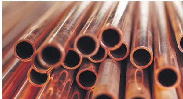
Wer auf Kupfer in der Hausinstallation setzt, sollte auf gutgeprüfte Rohre und Materialien achten.

So bleiben die Rohrleitungen ein Hausleben lang fit