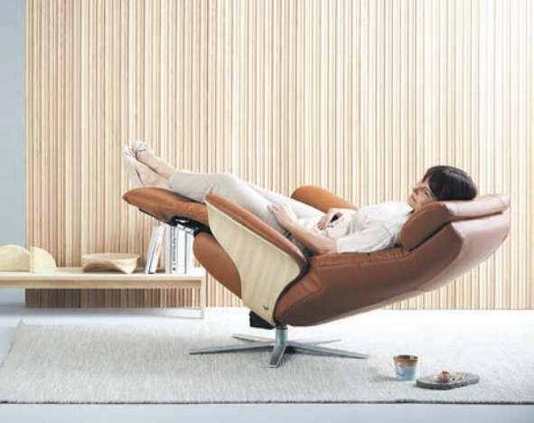
Einfach mal die Füße hochlegen: Die Herz-Waage-Funktion kann zur tiefer Entspannung beitragen.

Nützliche Funktionen in attraktivem Design Praktisch ist zudem eine Motorisierung, mit der sich der Relaxsessel per Knopfdruck in die gewünschte Ruheposition bewegen lässt. Sorgfältig ausgewählte Materialien tragen dazu bei, ein hohes Maß an Unterstützung und Druckentlastung zu schaffen. Neben den Vorteilen für das Wohlbefinden sollen sich aber auch funktionale Sitzmöbel harmonisch in jeden Wohnstil integrieren. Ein ansprechendes, fließendes Design trägt ebenso dazu bei wie eine Vielzahl an attraktiven Farben. Mehr Informationen gibt es etwa unter www.stressless.com sowie im Möbelfachhandel vor Ort.