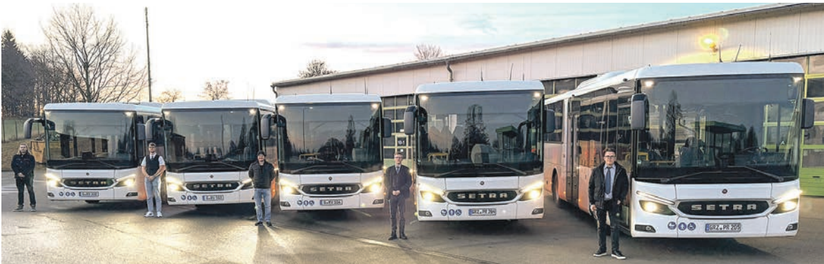
PRG und RVG haben fünf neue Linienbusse vom Typ Setra S 510 LowEntry übernommen, die künftig in Greiz und Gera eingesetzt werden.