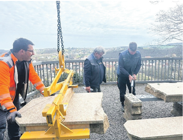
An der Paulinenhöhe gehören Pflege- und Instandhaltungsarbeiten zu den regelmäßigen Aktivitäten der Freien Wähler Weida.

gemeinsam mit dem langjährigen Unterstützer Ralf Tippner, früherer Inhaber der „Vitamin-Oase“ Weida, allen fünf Kindergärten der Stadt wieder ein umfangreiches Obst- und Gemüsefrühstück übergeben. Ralf Tippner sei im Oktober 2025 nach schwerer Krankheit verstorben, heißt es in der Mitteilung. Für den AWO-Kindergarten in Steinsdorf waren Vereinsmitglieder nach eigenen Angaben bei Reinigungsarbeiten an der Einfassung des großen Sandkastens am „Carport“ im Einsatz und bereiteten damit einen neuen Farbanstrich vor. Regelmäßig gepflegt wird laut