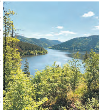
Blick auf die Hohenwarttalsperre.