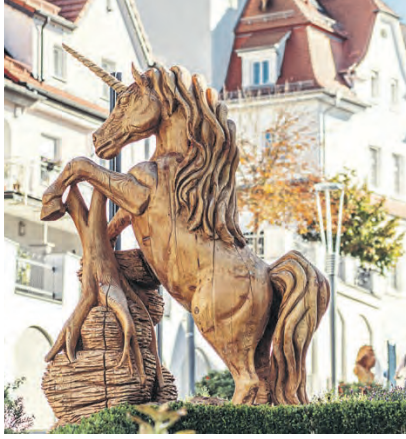
Das Einhorn ist das Wappentier der Stadt Giengen an der Brenz und stand Pate für das Einhorn Panschi, mit dem man vernünftige Abenteuer erleben kann.

pfad mit dem Einhorn Panschi fantastische Abenteuer erleben. Die Charlottenhöhle als längste begehbare Tropfsteinhöhle der Schwäbischen Alb: Spannend wird es im interaktiven Erlebnis-Museum um HöhlenSchauLand. Das Steiff Museum: Giengen ist die Hauptstadt der Teddybären. Die Naherholungs- und Freizeitanlage Burgberg am Fuße des Stettbergs als idyllisches Ausflugsziel.