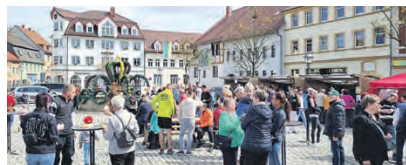
Wenn der Frühling Einzug hält, verwandelt sich der Markt- platz von Triptis in einen Treffpunkt für Familien, Vereine und Besucher in der Region.

kann und sich als Tradition etabliert hat. So markiert diese Ver-anstal-tung in Triptis nicht nur den Beginn der Osterzeit, sondern auch einen geselligen Auf-takt in die Freiluft-saison der Stadt – ein Anlass, bei dem Ge-meinschaft und Tradition im Mittelpunkt stehen.