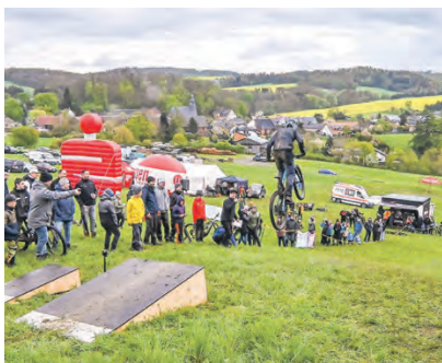
Schöne Aussichten für alle Beteiligten sind beim Longjump-Contest garantiert.