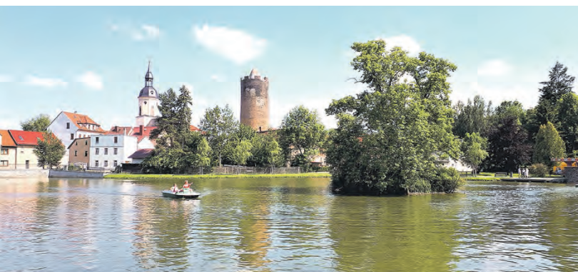
Stadtpark mit Stadtteich und Schlosswiese in Triptis – Der Triptiser Stadtpark entstammt einem trocken gelegten Sumpfbereich. Heute umfasst es einen Teich und Wiesenflächen mit Baumbestand. Auf den angelegten Wegen und den aufgestellten Bänken kann man bei Vogelgezwitscher die Seele baumeln lassen und die grüne Idylle genießen.

Zur Stadt gehören neben dem Kernort mehrere Ortsteile, darunter Burkersdorf, Döblitz, Hasla, Oberpöllnitz, Ottmannsdorf, Pöllnitzer und Schönborn. Insgesamt leben rund 3.700 Menschen in der Gemeinde, die durch ihre überschaubare Größe und ihre naturnahe Lage eine hohe Wohnqualität bietet. Zu den markanten Zeugnissen der Vergangenheit zählt der rund tausend Jahre alte Stadtturm, der als Wahrzeichen der Stadt gilt und an die Zeit der Vögte erinnert. Ebenfalls von historischer Bedeutung ist das