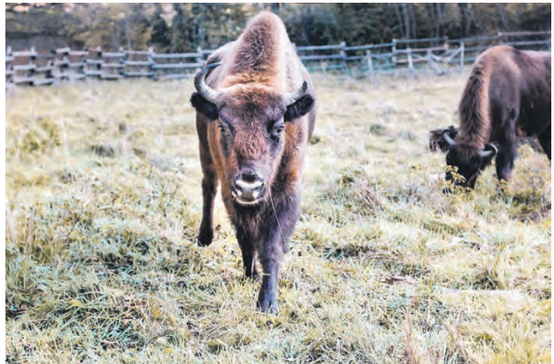
Wisentgehege in Ranis.