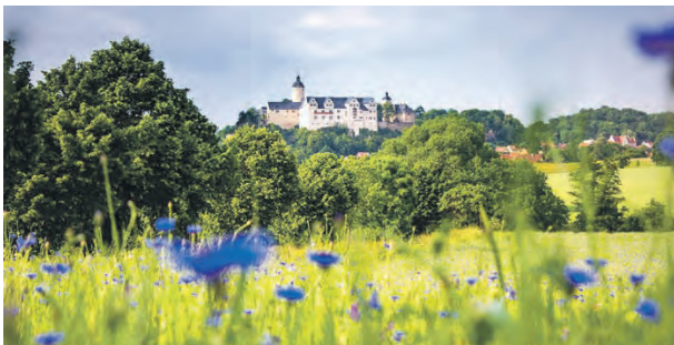
Die Burg Ranis bietet durch ihren märchenhaften Charme einen perfekten Ort zum Heiraten.

Ranis/Ziegenrück (ab). In der Verwaltungsgemeinschaft Ranis-Ziegenrück aus dem thüringischen Saale-Orla-Kreis haben sich die Städte Ranis und Ziegenrück und elf Gemeinden zur Erledigung ihrer Verwaltungsgeschäfte zusammengeschlossen. Sie liegen zwischen den Städten Pößneck und Schleiz. Sitz der Verwaltungsgemeinschaft ist Ranis, eine Außenstelle befindet sich in Ziegenrück.