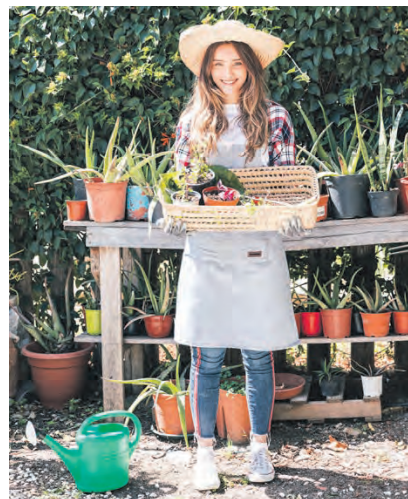
Aufgaben: Ordnung in den Garten bringen, Bodenverbesserung angehen, Bewässerungssystem installieren, Rasen mähen, Kompostieren, Gartenmöbel sauber machen.

Die richtige Zeit für die Teichpflege Der richtige Zeitpunkt, um Ihren Teich fit für den Frühling zu machen, ist der Mai. Nach den Eisheiligen, wenn keine strengen Fröste mehr zu erwarten sind, können auch empfindliche Fische und Pflanzen wieder in den Teich. Sie können jedoch schon im März damit beginnen, Ihren Teich auf das Frühjahr vorzubereiten. Werden die Tage wieder wärmer, können Sie den Eisfrierhalter abbauen. Sie säubern ihn und lagern ihn für den nächsten Winter ein.