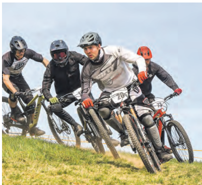
Am 25. April geht es beim Wiesenslalom am Oschitzer Lohmen wieder mit reichlich Speed den Berg hinab.