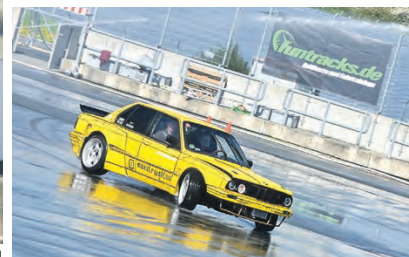
Driften für den guten Zweck – ein Erlebnis der besonderen Art ist wieder am 11. April auf dem Schleizer Dreieck möglich.

Saisoneröffnung auf dem Schleizer Dreieck