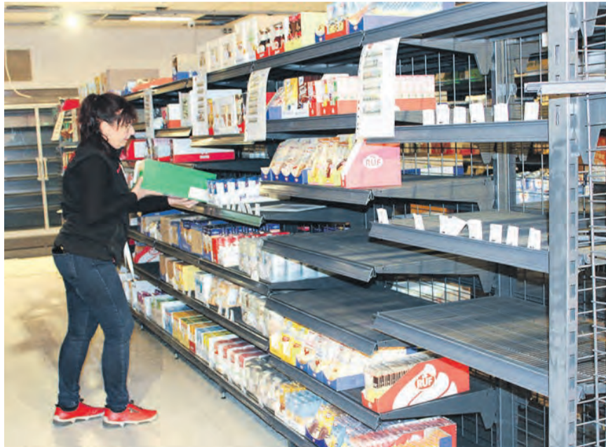
Das Befüllen der Regale und Kabel, die noch von der Decke hängen – und trotzdem liegt schon diese besondere Spannung in der Luft.