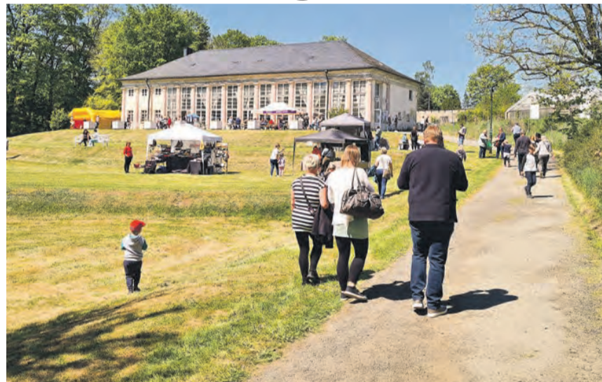
Frühlingmarkt in Saalburg-Ebersdorf.