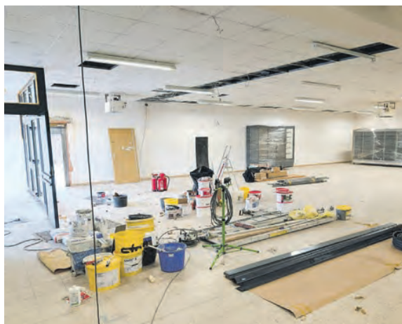
Nach vor wenigen Tagen sah es im ehemaligen KONSUM Treffer Markt so aus. Die fleißigen Bauarbeiter brachten aber das Kunststück fertig, aus dem lange leerstehenden Markt, innerhalb von nur wenigen Arbeitswochen eine für Saalburg lange fehlende lokale, schicke Einkaufsmöglichkeit vor Ort zu schaffen.