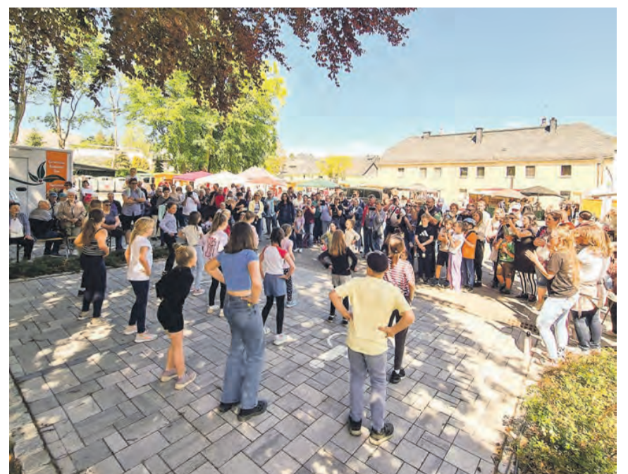
Viel los ist zum Frühlingmarkt in Saalburg-Ebersdorf.

Pflanzenständen lockt der angegliederte Flohmarkt mit kleinen und großen Schätzen. Ob