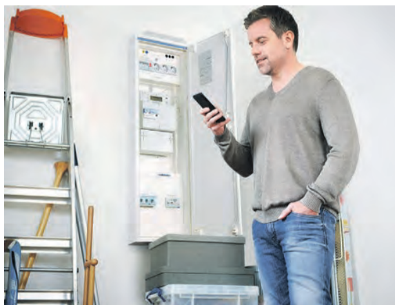
Flexibilität zahlt sich aus: Mit einer cleveren und zeitlich flexiblen Energienutzung können Verbraucher bares Geld sparen.

So können Verbraucher von einem flexibleren Umgang mit Strom profitieren