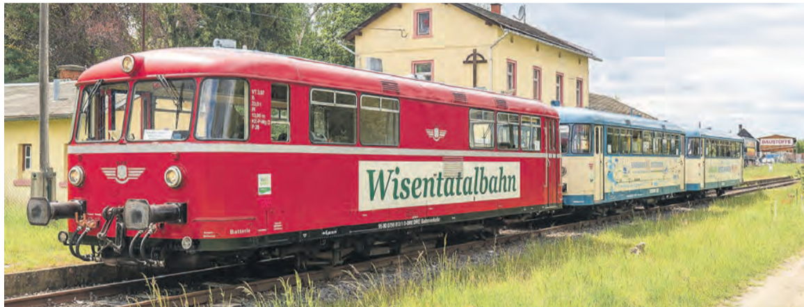
Die Wisentatalbahn Schönberg – Schleiz.