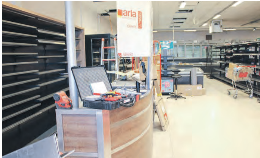
Wenige Tage vor der Eröffnung, wenn der Markt noch wie eine Baustelle wirkt, aber am Eröffnungstag strahlen wird wie neu geboren.