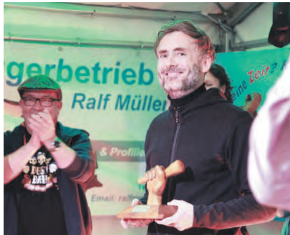
Schönste Momente vom Weinfest aus dem letzten Jahr.

Lesung: „Gleichgewicht“ – Jens Tiersch (ca. 17:00 Uhr in der Kirche). Reisen hilft den Kreislauf der Fehlinformationen und der eigenen Ängste zu durchbrechen. Nie zuvor in einen Kajak gesessen, macht sich der Autor auf, um einen alten Traum zu verwirklichen. nRaus aus der Komfortzone, nimmt er den Leser in einem Fesselnden Abenteuerbericht 2694 km mit Richtung Osten. Eine Lesung aus einem Abenteuerbericht mit Diashow und persönlichen Schilderungen. besonderer Erlebnisse, von