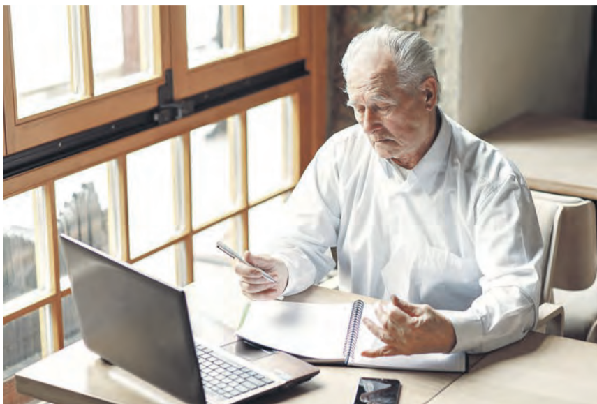
Die am 1. Januar 2026 in Kraft getretene Aktivrente ist ein steuerlicher Bonus. Wer nach Erreichen der Regelaltersgrenze weiterarbeitet, kann bis zu 2.000 Euro brutto monatlich steuerfrei hinzuverdienen.

Unternehmen, die das Instrument nutzen möchten, haben jedoch einige steuerliche, arbeitsrechtliche und organisatorische Regeln zu beachten.