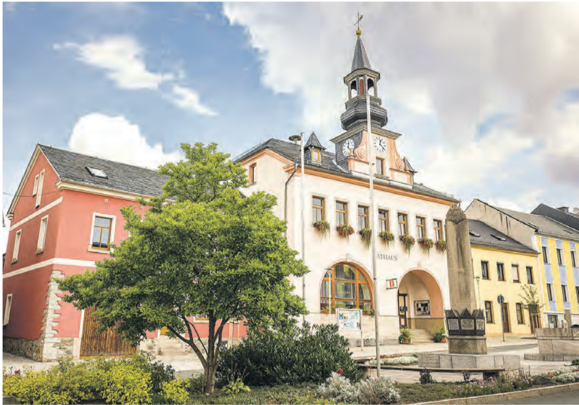
Blick auf das Rathaus in Saalburg.

Saalburg. (Stadt) Saalburg-Ebersdorf - zwischen Wasser, Wald und weitem Blick gewinnt die wirtschaftliche und touristische Entwicklung am Thüringer Meer in den letzten Jahren spürbar an Dynamik. Die Stadt Saalburg-Ebersdorf, idyllisch gelegen an der Bleilochtalesperre festigt dabei ihren Ruf als attraktiver Anlaufpunkt für Erholungssuchende in Ostthüringen. Bemerkenswert ist dabei weniger ein einzelnes Großprojekt als vielmehr das strategische Zusammenspiel vieler einzelner Maßnahmen, die den Standort nachhaltig stärken. Von der Sicherung der Nahversorgung über neue Aufenthaltsangebote bis hin zu konsequenter Digitalisierung und ambitionierten Infrastrukturvorhaben entsteht ein stimmiges Gesamtbild touristischer Entwicklung. Ein sichtbares Signal setzt die geplante Neueröffnung eines Nahkaufs im Ortsteil Saalburg am 28. April 2026. Für Gäste wie Einheimische gleichermaßen