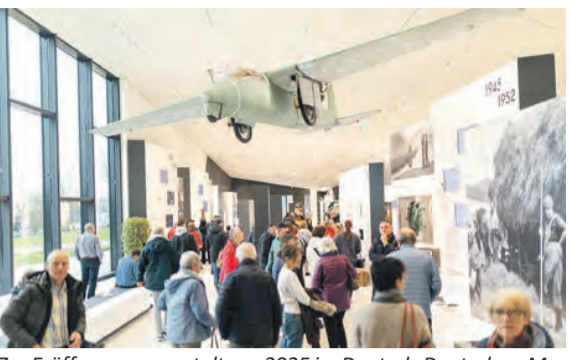
Zur Eröffnungsveranstaltung 2025 im Deutsch-Deutschen-Museum Mödlareuth

Gebäudes und der neuen Dauerausstellung rückte das Museum stark in den Fokus der Medien: Über 30 nationale und internationale Reporter berichteten aus Mödlareuth – darunter im April ein ausführliches Interview mit der Zeit. Der absolute Höhepunkt des Jahres war die feierliche Einweihung des neuen Museumsgebäudes am 2. Oktober 2025 im Beisein von Bundespräsident Frank-Walter Steinmeier und seiner Frau Elke Bundenbender sowie der beiden Mi-