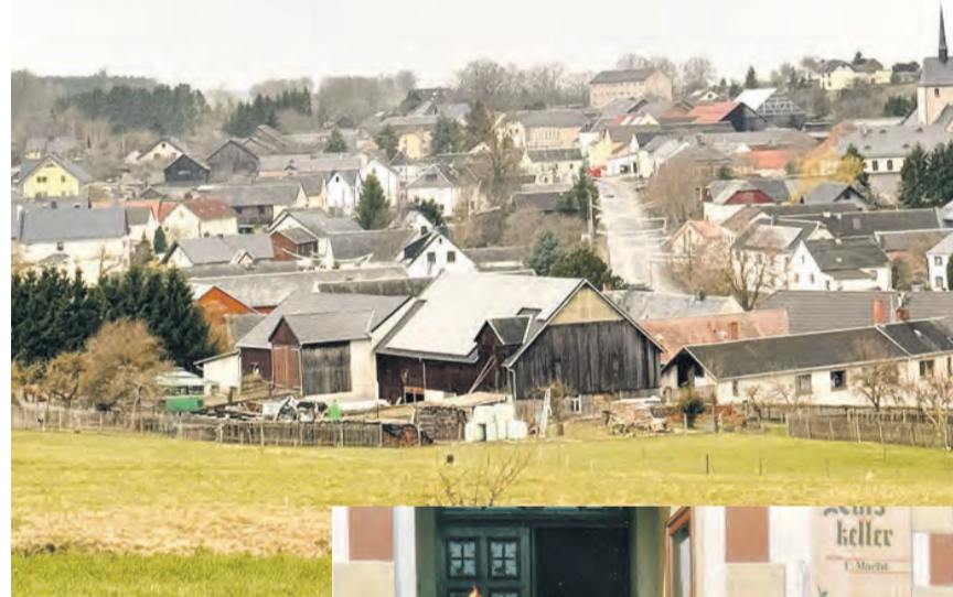
Blick auf Thierbach.